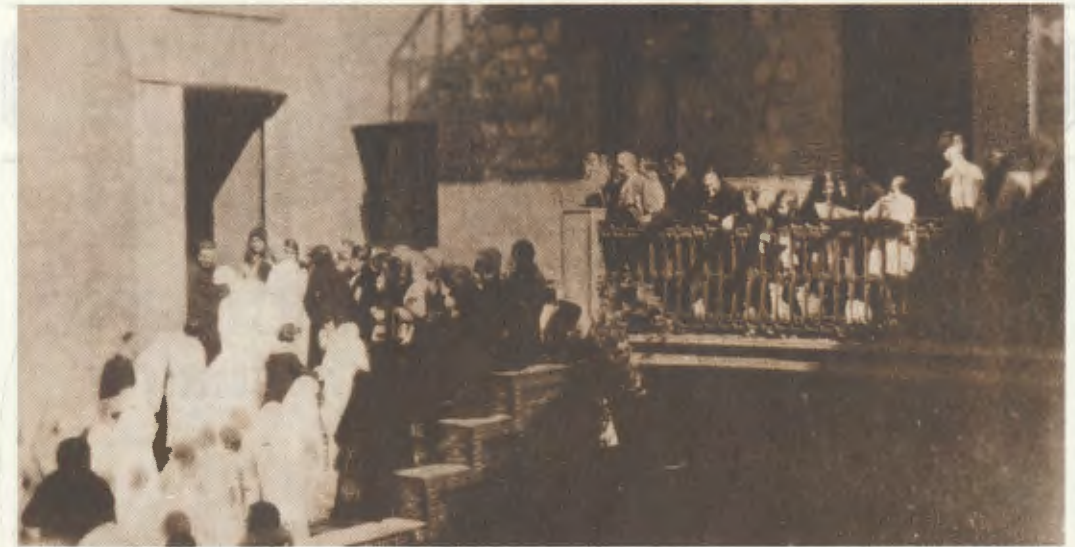
Sur cette photo de l'époque (1929), on aperçoit le Serviteur de Dieu — à gauche dans l'embrasure de la porte — un jour de Première Communion, à la Fondation des Malades.

C'est ainsi que, sous l'impulsion du Père, d'autres catéchèses purent commencer, tout au long de ces années trente, au cours desquelles l'Opus Dei faisait ses premiers pas. Entre autre, celle qui fut réalisée sur indication du Vicaire, en réponse à la demande de don Josemaría, et qui commença en mars 1935 dans la "colonia popular".