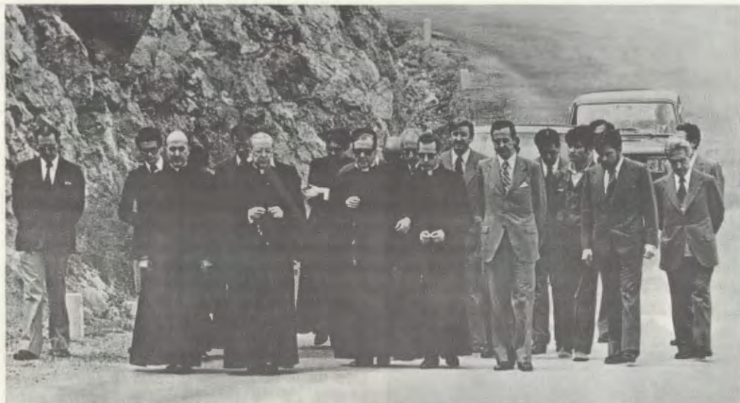
Le Serviteur de Dieu prie le Rosaire avec quelques-uns de ses fils, sur le chemin menant à la chapelle de Torreciudad, le 24 mai 1975.

déchaussa et parcourut à pied ce dernier bout de chemin. La route n'était pas encore goudronnée, et les cailloux blessaient ses pieds. Il marchait lentement et le temps n'était pas clément.