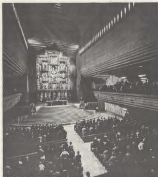
Intérieur du Sanctuaire de Torreciudad.

La route vient de quitter Barbastro (Espagne). Elle longe maintenant la rive droite du Cinca; puis pénètre dans le Somontano; le paysage devient sauvage. Au-delà du barrage de El Grado, le Cinca devient un lac aux rives escarpées que l'eau ne peut recouvrir. Sur la rive gauche du lac, perchée sur un promontoire, se trouve l'ancienne chapelle et à ses côtés une tour de guet à moitié détruite. Un peu plus haut, le nouveau sanctuaire et ses édifices attenants, siège d'un travail spirituel dont rêvait le Fondateur de l'Opus Dei. En toile de fond, le ciel d'un bleu intense où se découpe la masse imposante des Pyrénées aragonaises.