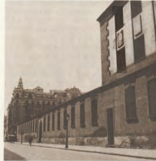
Asile de Porta Coeli. C'est ici, au début des années trente, que le Serviteur de Dieu réalisa une partie de son immense travail de catéchèse.

Vers le mois de mars 1932, l'enseignement de la religion fut supprimé dans tous les centres d'enseignement public de l'Espagne. Des familles vinrent alors trouver don Josemaría pour qu'il enseigne la catéchèse à leurs enfants.