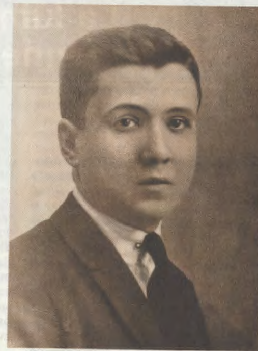
Le Serviteur de Dieu à l'âge de 15 ans.

Une fois que leur âme est en état de grâce, les chrétiens peuvent devenir des semeurs de paix et de joie (18) au milieu des hommes. L'apostolat, devoir que nous avons tous d'amener les autres à la rencontre du Christ, trouve ainsi dans le sacrement de la Pénitence à la fois une garantie sûre d'efficacité et un objectif bien précis. Un des grands services qu'un chrétien peut rendre à un ami consiste en effet à l'aider à s'approcher de la confession sacramentelle, où nous faisons l'expérience de la joie d'être pardonnés de Dieu.