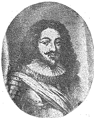
Miguel de Oquendo. Madrid, Museo Naval.

luna del almirante español. Este se destacó con la capitania y llegó a tocar la del almirante Tromp, que, maniobrando, esquivó, con lo que Oquendo, al descubierto, se vio sometido a la artillería de sus enemigos en solitario, con una cantidad considerable de bajas, y salió malbaratado. El intentaba acortar distancias para la lucha de mosquete, pero el enemigo la alargaba para emplear su artillería. La noche dio tregua, que se extendió, con más o menos actividad, hasta el 18. Volvió a mostrarse la superior táctica del enemigo, que, formado en dos columnas, cogió entre dos fuegos a la escuadra de Oquendo. La segunda fase del combate comenzó el 21; la superioridad de los holandeses en naves y maniobra fue decisiva. El buque insignia, el Santiago , ante el desastre de la escuadra, se retiró después de dura lucha al puerto de Mardique. Enfermo tras este combate, regresó Oquendo poco después a España y murió en La Coruña el 7 de junio de 1640.