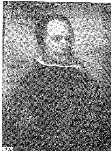
Antonio de Oquendo. Madrid, Museo Naval.