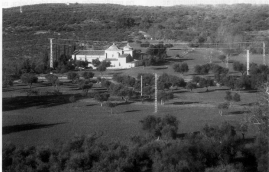
Ermita de San Benito

ANTONIO FONTÁN Este año 2009 que comienza es el vigésimo año de vida de Nueva Revista . Hemos cumplido ya nuestros primeros diecinueve años. Empezar el año veinte supone ya una cierta mayoría de edad.