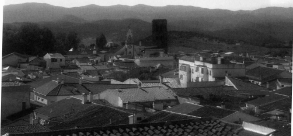
Panorámica de Guadalcanal desde la iglesia de Santa Ana