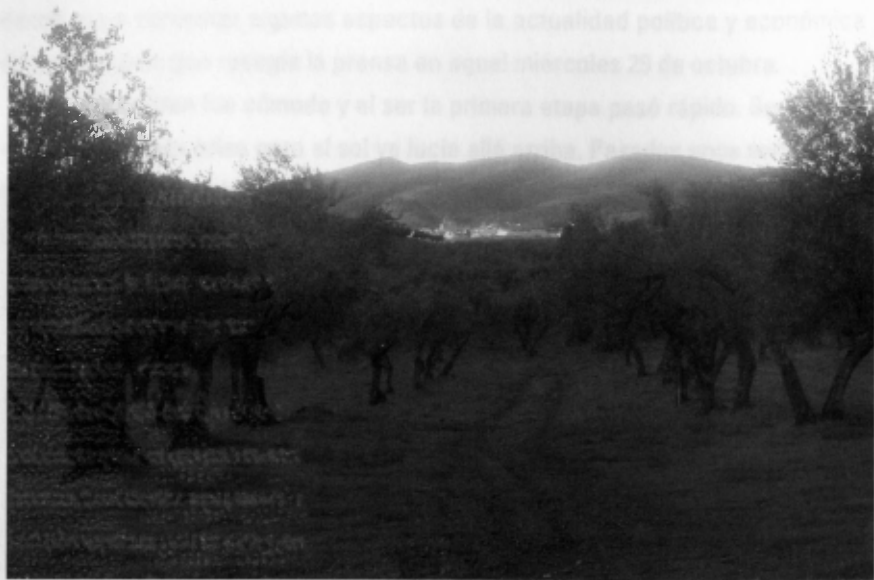
Vista de Guadalcanal entre olivos

el punto de contar chistes o derramarse el vino de alguna copa provocando las bromas y comentarios de todos. Lo serio se dejaba para la conversación que empezaría después y para la que se había habilitado una sencilla estancia con estufa, pues, a media tarde y a la sombra, el frío de la sierra se empezaba a notar.