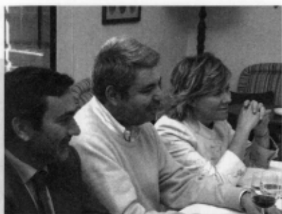
Almuerzo en Villa Susana