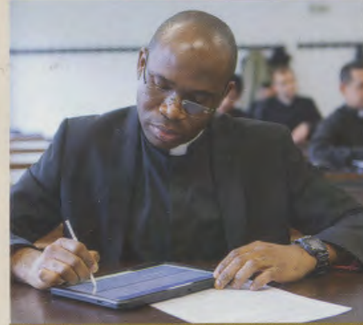
La Facultad de Teología, en el corazón de la Universidad de Navarra, constituye un centro de estudio y de diálogo interdisciplinar con las facultades civiles, abierto a todos los ámbitos del pensamiento humanístico y científico.

En la sociedad contemporánea no faltan cuestiones que interpelan a la humanidad y que reclaman una reflexión conjunta desde diversas perspectivas complementarias. Pensemos, por ejemplo, en la preservación de los recursos naturales y el cuidado del planeta Tierra, donde la fe bíblica en escucha y diálogo con las ciencias naturales puede sugerir aportaciones creativas, como lo demuestra la reciente encíclica Laudato si' del Papa Francisco . O bien, un análisis en profundidad de las realidades que generan situaciones de pobreza y la búsqueda de un desarrollo sostenible reclaman que expertos en sociología, derecho internacio-