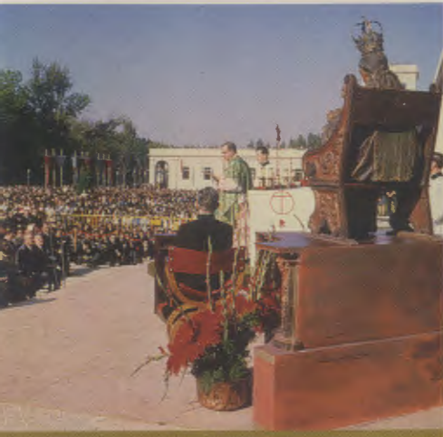
El Instituto de Teología de la Universidad de Navarra nació en octubre de 1967. El día 8 de ese mismo mes y año, san Josemaría predicó en Pamplona la emblemática homilía «Amar al mundo apasionadamente».

tulo emblemático de «Amar al mundo apasionadamente». El entorno al aire libre de aquella eucaristía ofrecía un paisaje evocador acerca del ámbito en el que desarrollar el quehacer teológico: «Nos encontramos —observaba— en un templo singular; podría decirse que la nave es el campus universitario; el retablo, la Biblioteca de la Universidad; allá, la maquinaria que levanta nuevos edificios; y arriba, el cielo de Navarra... ¿No os confirma esta enumeración, de una forma plástica e inolvidable, que es la vida ordinaria el verdadero lugar de nuestra existencia cristiana? Hijos míos, allí donde están vuestros hermanos los hombres, allí donde están vuestras aspiraciones, vuestro trabajo, vuestros amores, allí está el sitio de vuestro encuentro cotidiano con Cristo».