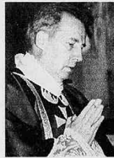
Monsignor Javier Echevarria

Monsignor Javier Echevarria, vescovo prelado della prelatura personale dell'Opus Dei, ha scritto questo articolo per «La Stampa» per ricordare 50 anni di sacerdozio di Giovanni Paolo II