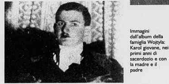
Immagine dall'album della famiglia Wojtyla. Carlo giovane, nei primi anni di sacerdozio e con la madre e il padre

«Una testimonianza rivolta in particolare a chi vive un periodo di crisi della vocazione»