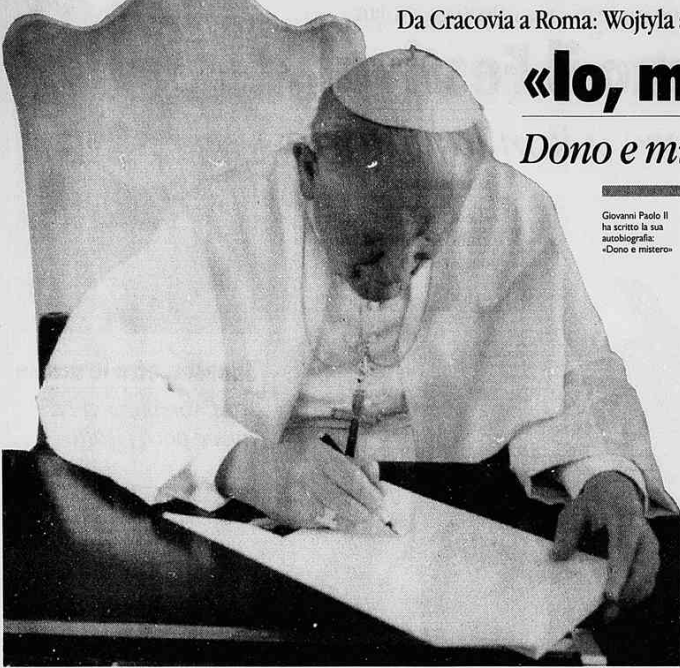
Giovanni Paolo II ha scritto la sua autobiografia: «Dono e mistero»

Da Cracovia a Roma: Wojtyla si racconta in un libro, è la prima volta di un Pontefice