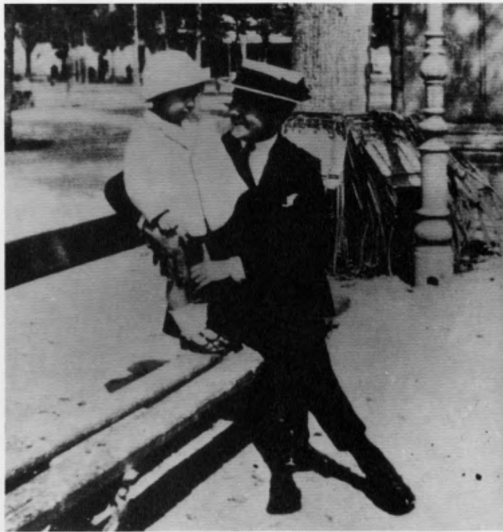
Logroño, 1918 y 1919.

antes, así como en varias de Africa y del Lejano Oriente, y en todas y cada una de las repúblicas americanas, siempre en relación con los Obispos de cada país, y ordinariamente a petición de ellos.