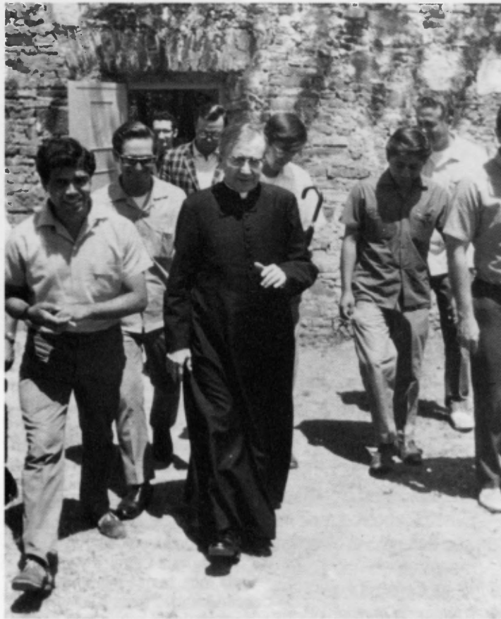
En México. Año 1972.

En 1934 Escrivá publicó en una modesta imprenta de la ciudad castellana de Cuenca sus