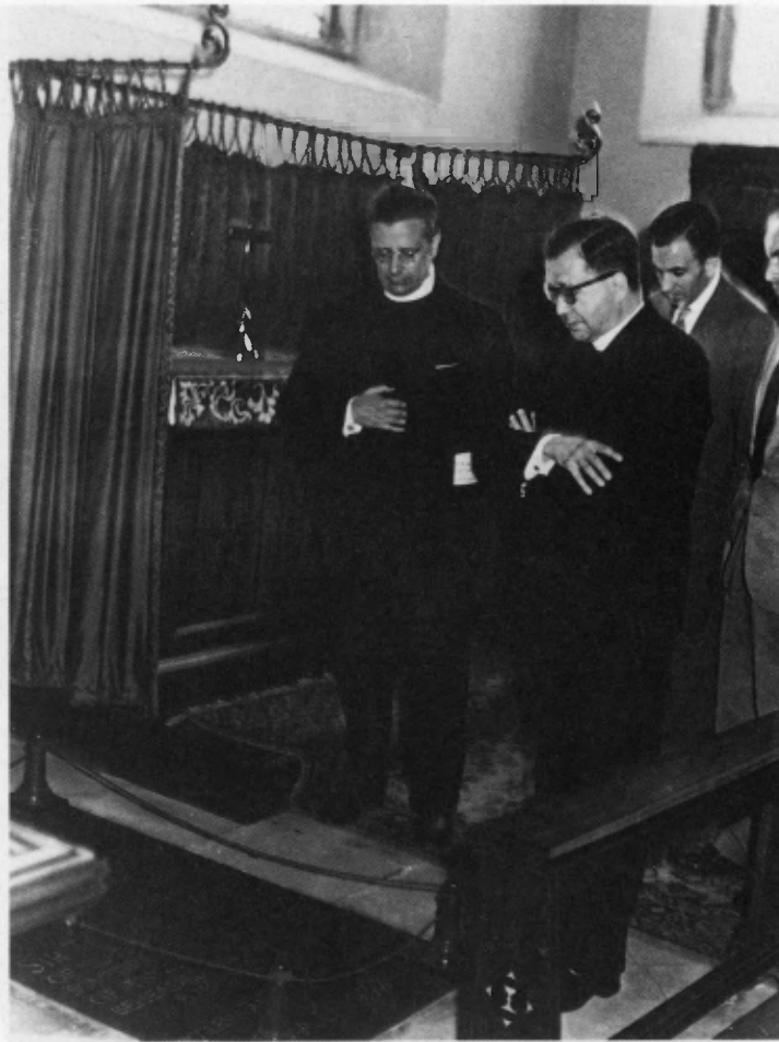
Canterbury, 1962. Ante la tumba de Sto. Tomás Moro.

Fueron más de mil trescientos los cardenales, arzobispos y obispos que se dirigieron a la Santa Sede con escritos postulatorios. Lo cual representaba una tercera parte larga de la Jerarquía de todo el mundo