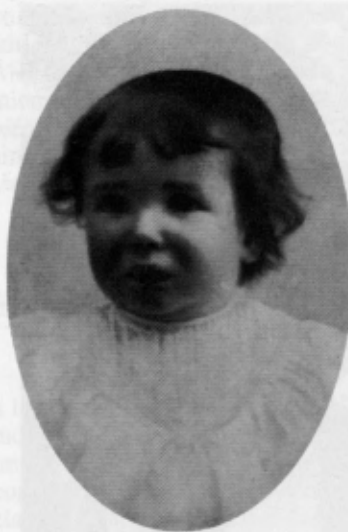
A los dos años de edad. Barbastro, 1904.

El Opus Dei habría de ser, necesariamente, porque son así las cosas en que intervienen los hombres, una organización —una desorganizada organización dijo en alguna ocasión el fundador— y, sobre todo, un mensaje, que era a la vez viejo por evangélico, y nuevo por olvidado