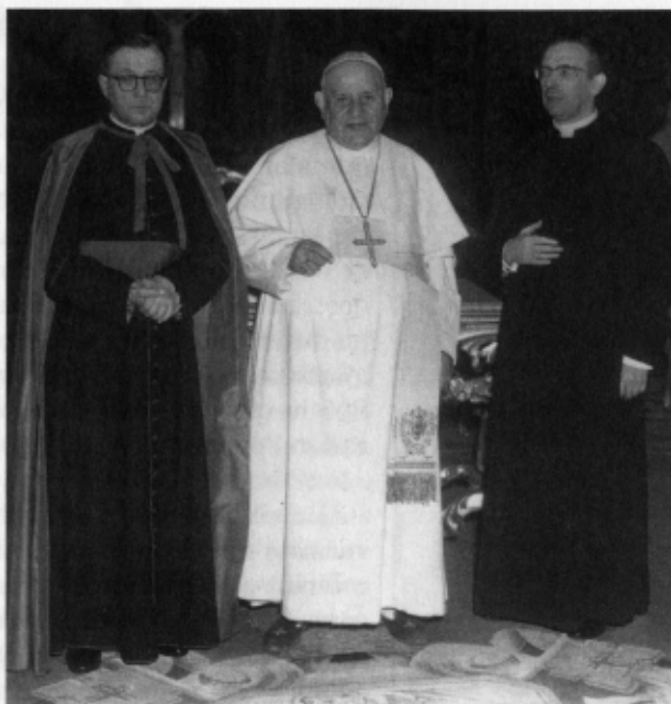
El beat Josep Maria Escrivà i Mons. Álvaro del Portillo en una audiència del 1960.

És innegable, al meu parer, que els temes d'aquestes tres homilies, tot i que universals, van ser triats de cara a la temàtica de les dues assemblees sinodals. La primera homilia, titulada Lleialtat a l'Església , és un ric comentari de les notes de l'Església.