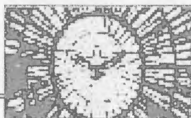
Con il beato Giovanni XXIII durante un'udienza del 5 marzo 1960, alla quale partecipa anche Mons. Álvaro del Portillo; in basso: con Paolo VI il 10 ottobre 1964

La predicazione di Don Josemaría sottolinea costantemente il primato della vita interiore sulle attività organizzative: «Queste crisi mondiali — afferma — sono crisi di santi». E la santità richiede sempre l'unità tra preghiera, lavoro e apostolato