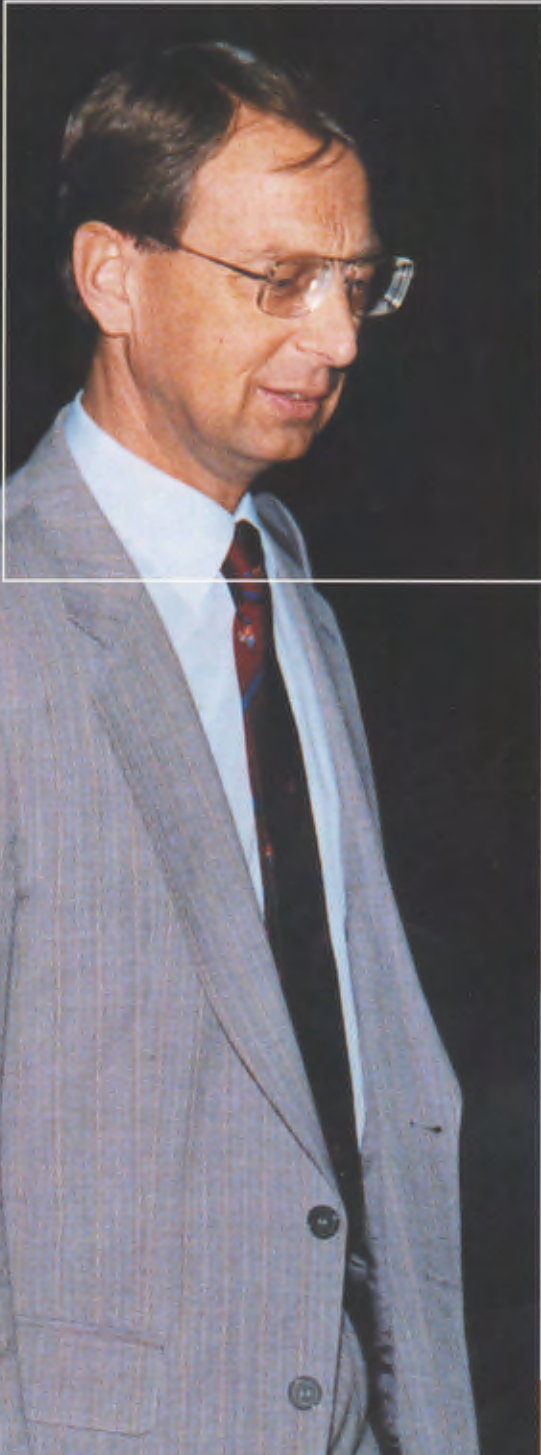
Trois mois avant sa mort, en compagnie de Monseigneur Alvaro del Portillo, Prêlat de l'Opus Dei.