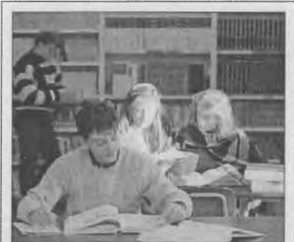
Tra gli eventi collaterali del Giubileo delle Università (3-10 settembre) uno dei più importanti è stato l'incontro promosso dalle realtà ecclesiali impegnate nella pastorale universitaria. Diverse Congregazioni, Famiglie religiose e altri Movimenti della Chiesa hanno promosso così, nelle giornate del 7 e dell'8 settembre, un incontro dedicato a verificare l'impatto del relativo carisma con la missione universitaria.