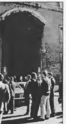
L'Ateneo della Santa Croce

«Quando il Signore elargirà il suo bene, la nostra terra darà il suo frutto» (Salmo 84, 13). Chi non ha contemplato qualche volta con ammirazione i corsi d'acqua impetuosi che precipitano dalle montagne ammantate di neve? Nella primavera del 1266 Tommaso d'Aquino si accingeva a pronunciare la lezione inaugurale come maestro di teologia nell'Università di Parigi. Aveva appena 31 anni e si sentiva indegno di una cattedra di tanto prestigio. Inoltre, non riusciva a pensare ad altri argomenti adeguati per tale intervento. Con questo genere di preoccupazioni, narrano i suoi biografi che si addormentasse e gli apparisse in sogno un anziano e tranquillo sacerdote, gli suggerì di commentare nella sua lezione le «metamorfosi» di Ovidio, con il frutto delle sue opere sulla terra. Tremante, in effetti, prese le mosse del suo discorso dai versi del salmo, che applicò ai docenti: come la pioggia impregna le montagne formandosi poi dei fiumi che fecondano le valli, così la sapienza perviene da Dio agli uomini attingendo gli insegnamenti. Questa metafora è stata considerata la istituzione come parte di un meccanismo. L'università, infatti, non è soltanto il luogo deputato alla preparazione professionale, né si riduce alla burocrazia della conoscenza.