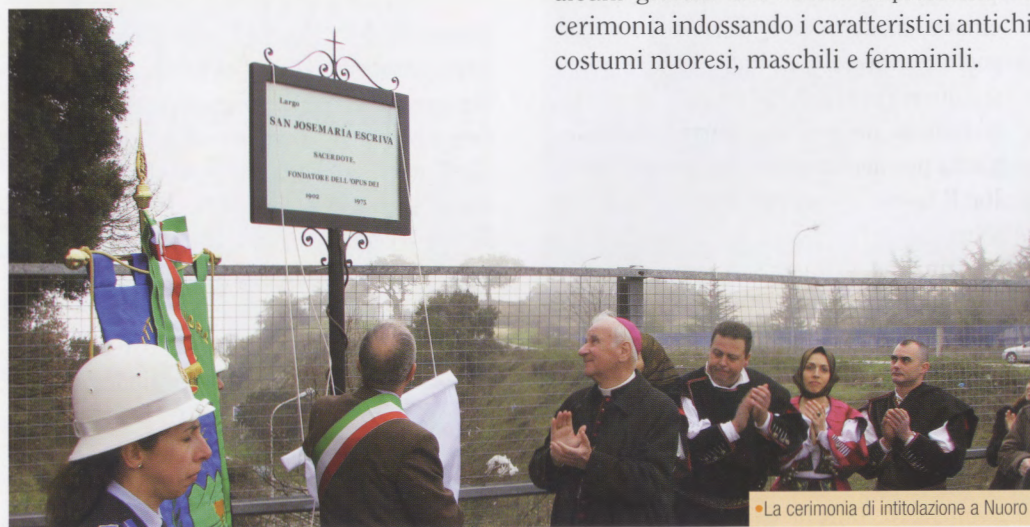
• La cerimonia di intitolazione a Nuoro

La cerimonia di intitolazione si è svolta alla presenza del Vescovo della diocesi di Nuoro mons. Pietro Meloni che ha rivolto parole di elogio per il sindaco e la giunta comunale che hanno dimostrato, ha detto, responsabilità e alto senso civico, con la decisione di dedicare uno spazio urbano al fondatore dell'Opus Dei. «D'altronde, ha spiegato il Vescovo, Largo san Josemaría si trova vicino a vie intitolate a uomini italiani e nuoresi illustri,