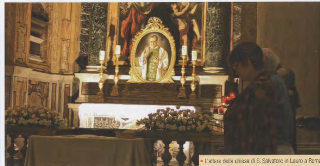
• L'altare della chiesa di S. Salvatore in Lauro a Roma

La devozione popolare per il «santo dell'ordinario» continua a concretarsi in numerose intitolazioni di strade e altre realtà.