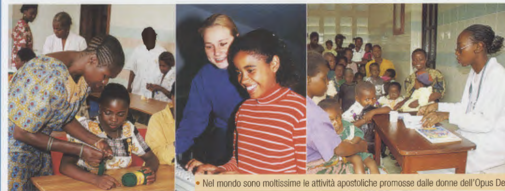
• Nel mondo sono moltissime le attività apostoliche promosse dalle donne dell'Opus Dei

Riportiamo di seguito la descrizione dei due avvenimenti, come viene narrata nel libro di Andrés Vázquez de Prada, Il Fondatore dell'Opus Dei , Edizioni Leonardo International.