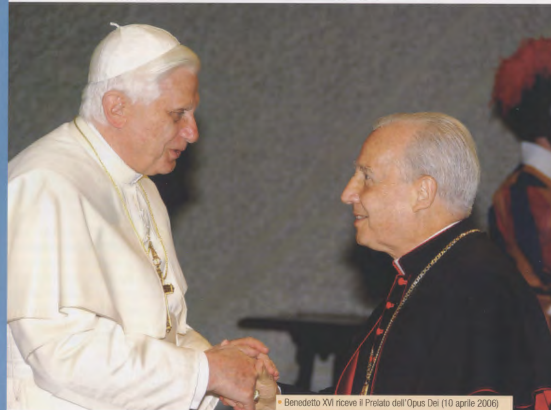
• Benedetto XVI riceve il Prelato dell'Opus Dei (10 aprile 2006)

Mons. Javier Echevarría, prelado dell'Opus Dei, è stato intervistato da Il Tempo di Roma, nel dicembre del 2008; ecco uno stralcio dell'intervista.