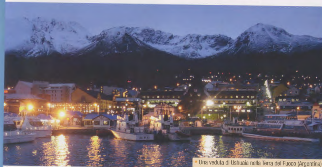
Una veduta di Ushuaia nella Terra del Fuoco (Argentina)

Il 27 febbraio 2009 alla presenza degli otto