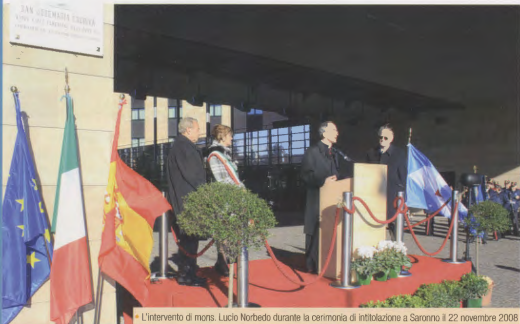
• L'intervento di mons. Lucio Norbedo durante la cerimonia di intitolazione a Saronno il 22 novembre 2008

La devozione popolare per il «santo dell'ordinario» continua a concretarsi in numerose intitolazioni di strade e altre realtà.