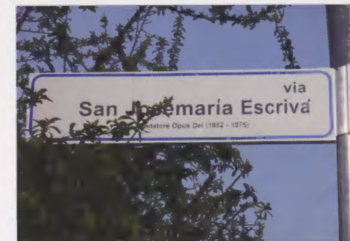
• Nella foto sopra: la cerimonia di intitolazione a San Josemaría di un parco urbano a Latina • Sotto: la targa della strada di Santa Maria Capua Vetere (Caserta) dedicata al fondatore dell'Opus Dei