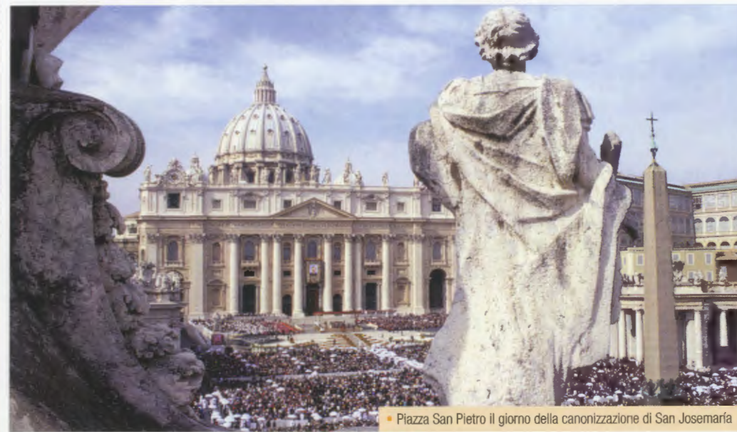
• Piazza San Pietro il giorno della canonizzazione di San Josemaría

Stralcio dell'articolo del cardinal Crescenzo Sepe, arcivescovo di Napoli, pubblicato su Il Mattino del 6 ottobre 2008. «L'Opus Dei e la santità quotidiana»