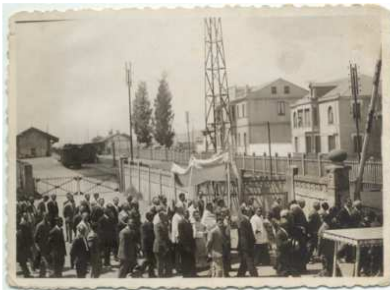
Estación de Veguellina de Órbigo hacia 1940.