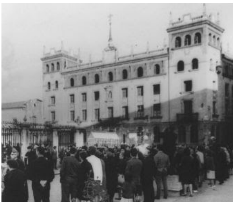
Procesión ante el Palacio Episcopal de León hacia los años 40.