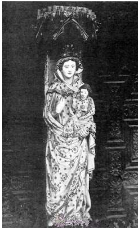
Imagen de la Virgen Blanca en el parteluz de la portada oeste de la Catedral de León.