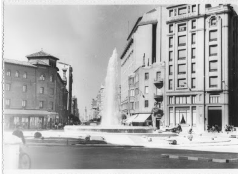
A la derecha, el antiguo Hotel Oliden. Foto Antonio. León.

Además, este buen sacerdote le pagó el hotel, le regaló unos dulces y le dio "una buena limosna", como diría más tarde D. Josemaría.