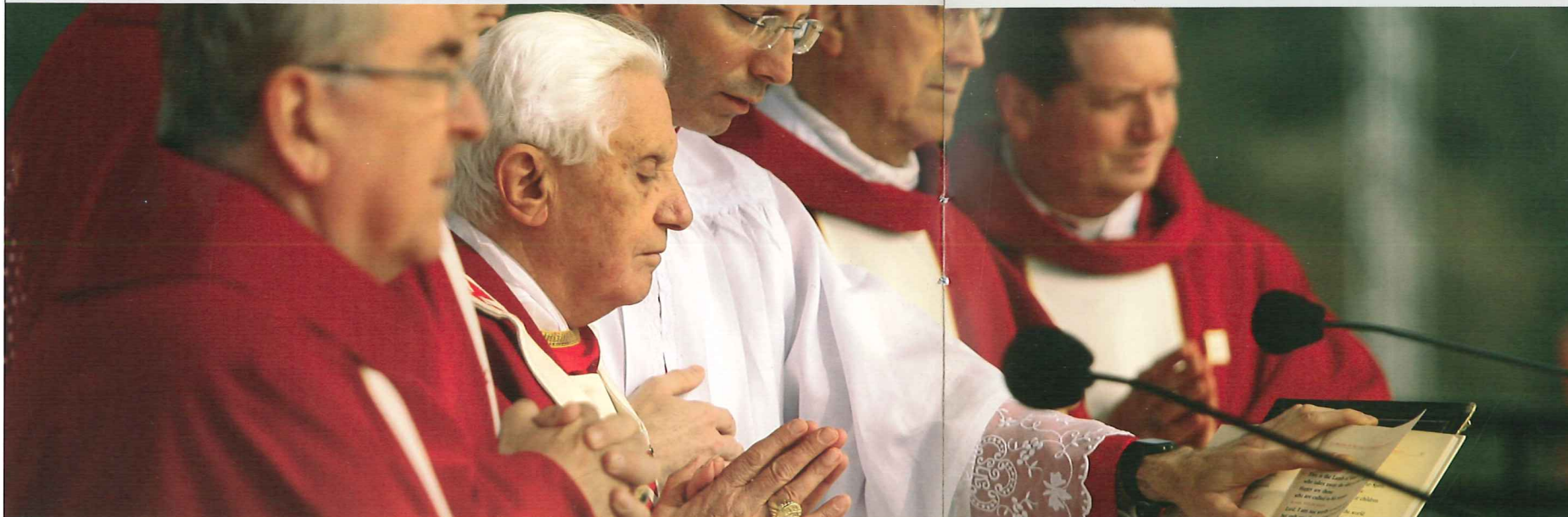
Benedicto XVI durante la Jornada Mundial de la Juventud, en Sydney (verano de 2008).