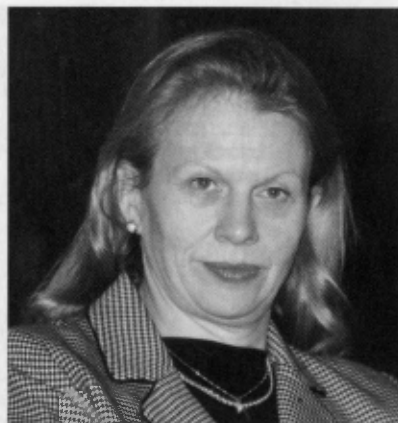
Janne H. Matlary Diputada, professora de Política Internacional de la Universitat d'Oslo

Matlary , ex vicepresidenta del govern noruec, va explicar que el descobriment dels escrits de Mons. Escrivà va suposar «una revolució copernicana» en la seva vida. Durant la seva conferència, titulada «El treball, camí de santedat», Matlary va recordar que «la primera clau per trobar a Crist en la pròpia feina ha de consistir necessàriament a fer-la bé en termes