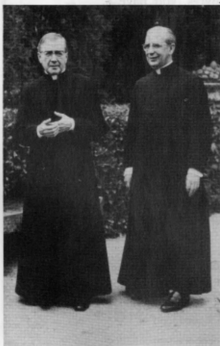
Mgr Escrivá avec Mgr del Portillo, actuel prélat de l'Opus Dei.