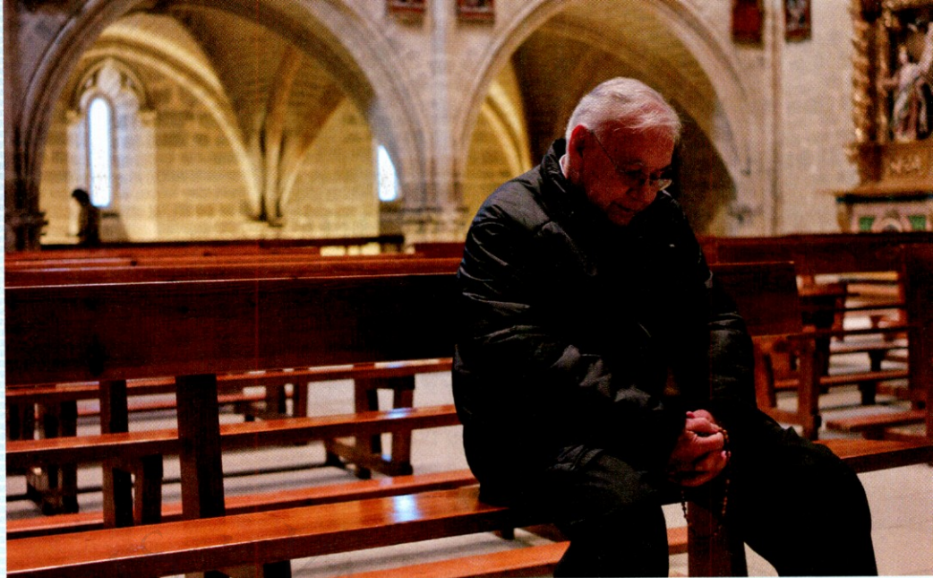
En su última visita a la iglesia fortaleza de Santa María de Ujué.