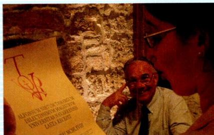
En una comida con el departamento.