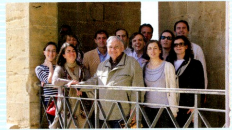
De excursión en Ujué.