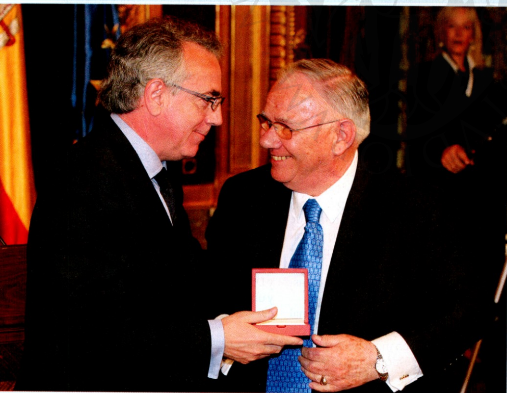
El presidente Miguel Sanz le entregó la Cruz de Carlos III el Noble de Navarra.