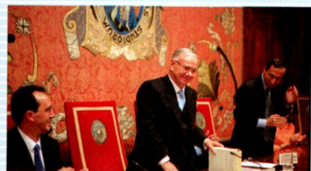
Durante su homenaje, en 2003.