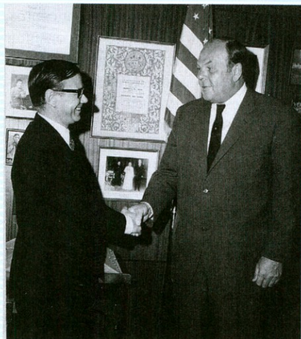
De visita en Estados Unidos.