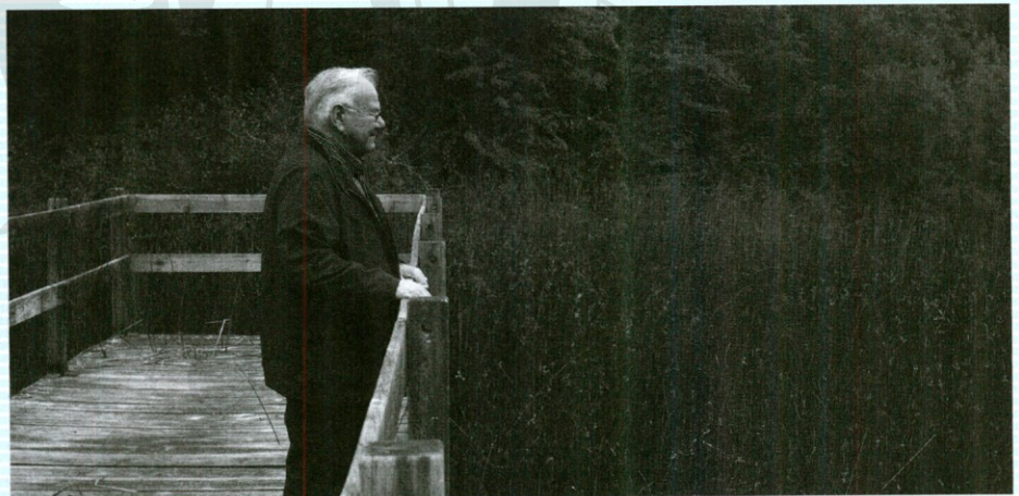
Disfrutando de la naturaleza en Zuasti.