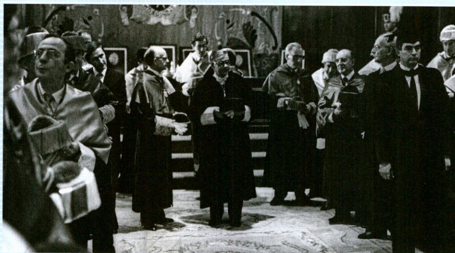
Durante una Apertura oficial de curso.