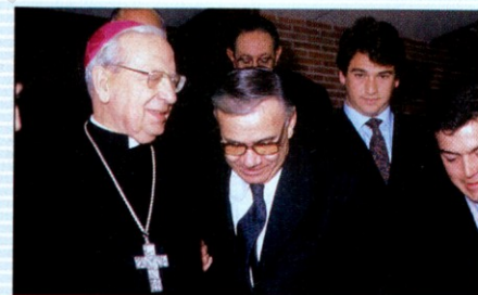
Con Álvaro del Portillo.