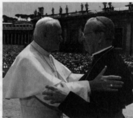
Joan Pau II saluda afectuosament Mons. Álvaro del Portillo després de la beatificació de Josepmaria Escrivà, fundador de l'Opus Dei.

de relació entre ordinariats militars i diòcesis territorials s'articula a través de la institució de la potestat cumulativa. Això vol dir que els fidels que pertanyen a l'Ordinariat militar també són membres de les diòcesis en què tenen el seu domicili; així, doncs, i en favor d'aquests fidels, poden actuar tant l'Ordinariat militar i els seus capellans com el Bisbe diocesà i els rectors dels llocs en què habiten els militars. És clar, però, que la potestat cumulativa no comporta l'actuació simultània de tots aquests agents: per regular, a la pràctica, les prioritats d'actuació s'han previst, en la Spirituali militum curae , un seguit de regles coordinadores, que bàsicament reconeixen la prioritats dels capellans castrens en els llocs i establiments militars (casernes, hospitals, centres d'ensenyament, etc.) i la competència primària de la jurisdicció diocesana i parroquial quan els militars siguin fora dels llocs que es consideren d'aquesta manera 18 .