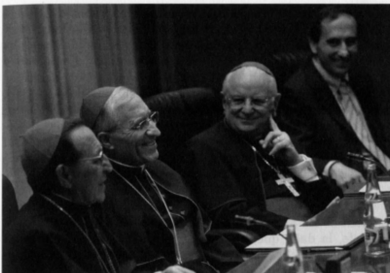
Commemoració dels 25 anys de l'Opus Dei com Prelatura personal a Madrid, el 2 de maig de 2008. Els cardenals Herranz i Rouco i Mons. Francesco Monterisi, secretari de la Congregació per als Bisbes.

funcional. D'una banda, l'Abadia nullius i la Prelatura nullius eren comunitats jeràrquicament i territorialment organitzades, equiparades jurídicament amb les diòcesis; d'altra banda, els oficis capitals d'aquestes abadies i prelatures tenien unes funcions i unes potestats semblants a les dels bisbes diocesans.