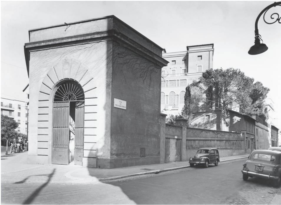
Villa Tevere a mediados de los años cincuenta desde la esquina Bruno Buozzi – Villa Sacchetti.