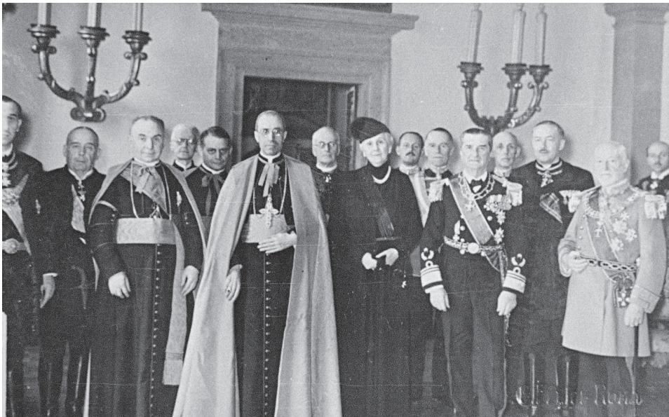
Villa Mazzoleni en 1936. El cardenal Pacelli y el almirante Horthy en la Legación de Hungría ante la Santa Sede.