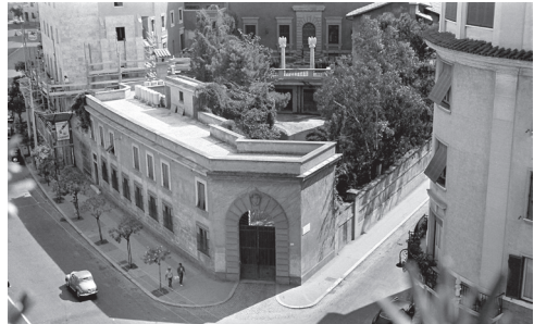
El Pensionato en los años cincuenta.