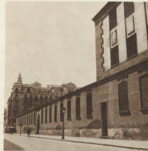
Asilo de Porta Coeli. Aqui, nos começos dos anos trinta, o Servo de Deus desenvolveu parte do seu imenso trabalho de catequese.

Em Julho de 1931, depois de deixar a capelania do Patronato de Enfermos, continuou e ampliou o seu trabalho de semear a boa doutrina em todos os ambientes. Por exemplo, já em 1932 ia ao asilo de Porta Coeli, na rua Garcia de Paredes, em Madrid, onde confessava e falava — dando catequese — com os rapazes aí recolhidos. Dirigia-se aonde se manifestasse alguma necessidade espiritual, sem