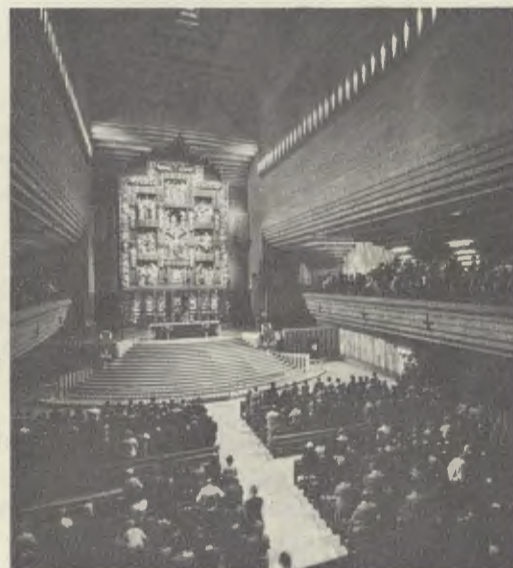
Interior do Santuário de Torreciudad.