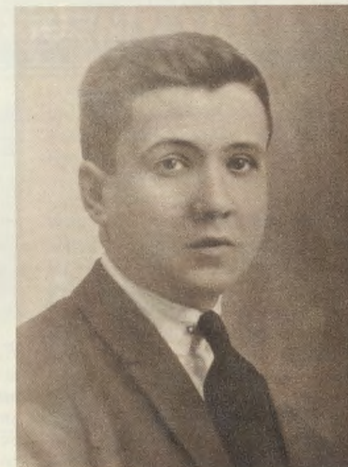
O Servo de Deus, com quinze anos.

Convidava a não esquecer a estreita relação que há entre o sacramento da Penitência e o divino alimento da alma que é a Eucaristia: Não deixeis de comungar com frequência: mas, se algo vos incomoda na alma, confessai-vos primeiro. Sem clareza de ideias, sem a consciência limpa, não vades nunca comungar: seria horrível (14).