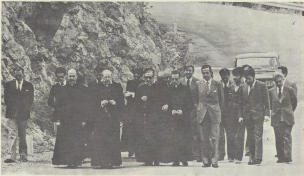
O Servo de Deus reza o Rosário, com um grupo de filhos seus, a caminho da Ermida de Torreciudad, no dia 24 de Maio de 1975.

chegar à ermida, num local onde agora se ergue um cruzeiro. Descalçou-se e fez este último percurso a pé. A estrada não estava ainda asfaltada e o cascalho feria-lhe os pés. O caminhar era lento, sob um tempo inclemente.