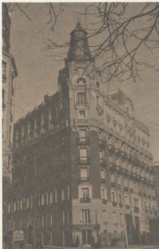
No primeiro andar deste edifício de Madri, na Rua Luchana, teve a sua sede a Academia DYA, de fins de 1933 até começos do ano letivo de 1934-35.

Um dos apostolados a que dava preferência naqueles anos era o apostolado com estudantes universitários, porque, tendo de chegar a todas as camadas da sociedade — essa era a precisa Vontade divina —, percebeu que com jovens universitários poderia realizar antes esse programa. Conversava com eles pelas ruas de Madri ou fazia com eles reuniões no lar de sua mãe. Quando se ausentavam da cidade em tempo de férias, continuava essa tarefa por correspondência. Eis aqui, por exemplo, umas linhas de uma carta dirigida a um daqueles rapazes: Tem absoluta confiança em Jesus. Fala-lhe como a um Amigo íntimo, que o é. Conta-lhe as tuas coisas e as nossas coisas. Passa-nos em revista a todos: aos velhos e aos novos... e a todos os que hão de vir, até o fim dos séculos. Convence-te de que Ele te ouve, porque é verdade. Enche-te de fé. De fé e de Amor. Invoca a Senhora e São José, nosso Pai e Senhor. Vive sempre em afetuosa camaradagem com o teu Anjo da Guarda. Tudo isto é devoção rija e sólida. Se uma vez por outra (ou muitas vezes) estás seco e árido, perante o Sacrário, sem saber o que dizer a Jesus... , monta-lhe a guarda: persevera como de costume, sem tirar um minuto: fiel, como um cãozinho aos pés do seu dono (1).