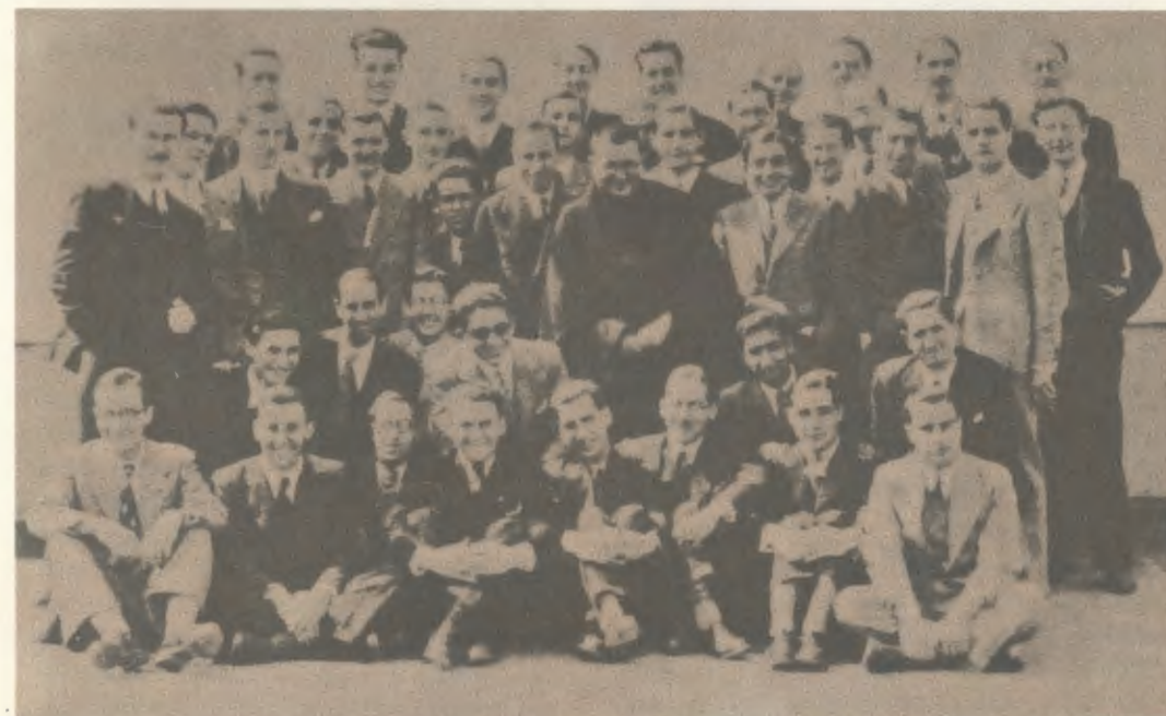
O Servo de Deus com alguns estudantes da DYA.

D. Josemaría entregou-se com total empenho a esta tarefa, dedicando-lhe grandes esforços e muitíssimas horas. Ensinava esses rapazes a observar a ordem, a aproveitar o tempo, a ser alegres, sinceros e piedosos, a amar o sacrifício que acompanha o cumprimento fiel do dever... Num pequeno gabinete, mobiliado com simplicidade, D. Josemaría recebia muitos que ali acorriam em busca de conselho e orientação. De uma das paredes pendia uma cruz de madeira, sem crucifixo; e o sacerdote explicava-lhes, em algumas ocasiões, o que depois deixou escrito em Caminho : Quando vires uma pobre Cruz de madeira, só, desprezível e sem valor... e sem Crucificado, não esqueças que essa Cruz é a tua Cruz: a de cada dia, a escondida, sem brilho e sem consola-