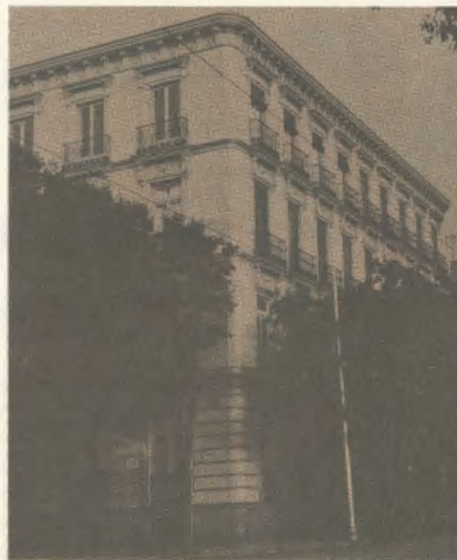
Neste edifício da Rua Ferraz, n.50 (Madri), a partir de outubro de 1934, a Residência DYA ocupou dois apartamentos no penúltimo andar; a Academia estava em um outro apartamento do último andar.