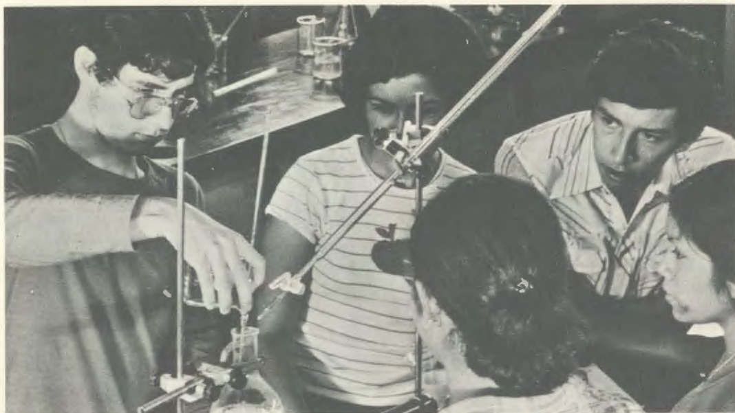
No laboratório de Química.

Eis um dado que corrobora o propósito de formação integral dos universitários: a proporção entre professores e alunos é de um para nove, de maneira que todo aquele que ingressa na Universidade tem assegurada a assistência direta de um professor até a finalização dos seus estudos.