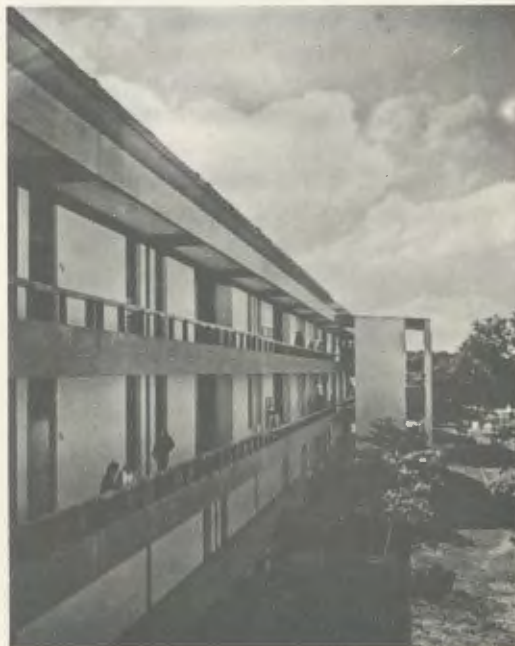
Um edifício da Universidade.

No meio de um areal que só alimenta alfarrobeiras, nasceu em 1968 a Universidade de Piura, fruto da convergência de um duplo empenho: por um lado,