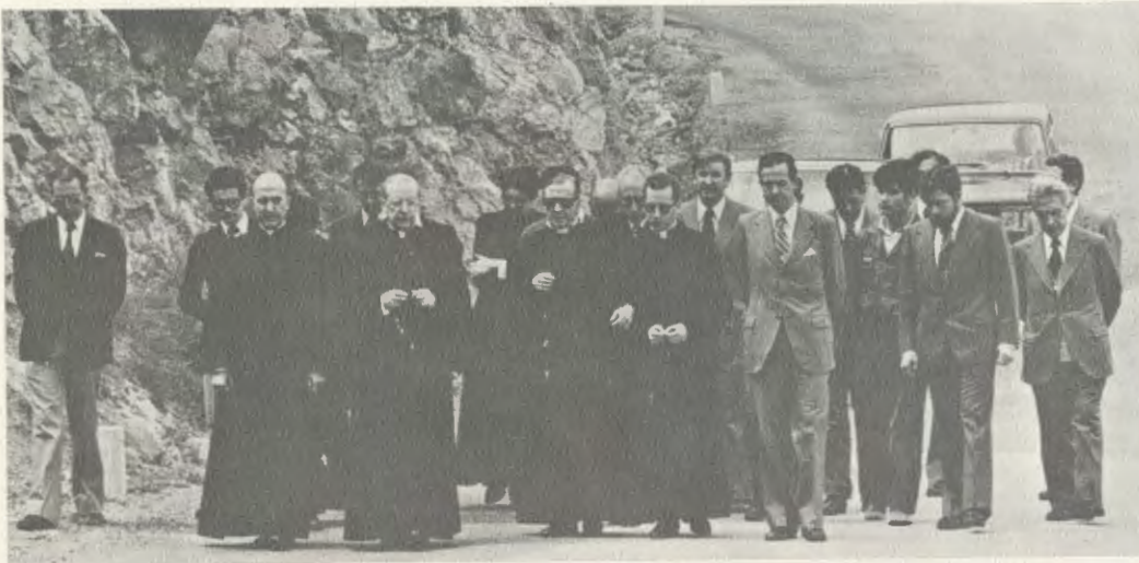
O Servo de Deus reza o Rosário, com um grupo de filhos seus, a caminho da ermida de Torreciudad, no dia 24 de maio de 1975.

zeiro, precisamente a um quilômetro da ermida. Descalçou-se e percorreu a pé este último trecho. A estrada ainda não estava asfaltada e os pedregulhos feriam-lhe os pés. A caminhada era lenta, no meio de um tempo desagradável.