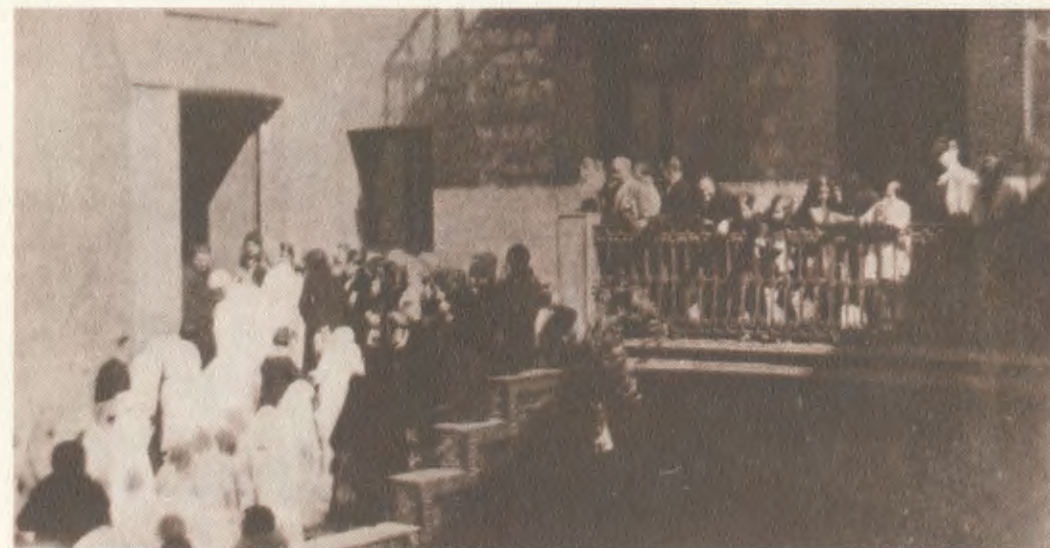
Nesta fotografia da época (1929), vê-se o Servo de Deus —no limiar da porta, à esquerda— num dia de Primeiras Comunhões, no Patronato dos Enfermos.

Era o começo de um trabalho fecundo a serviço da Igreja, iniciado pessoalmente pelo Fundador do Opus Dei, e que o Opus Dei desenvolve em todos os lugares do mundo onde trabalha. A vida de Mons. Escrivá foi um grande empenho de formação cristã, uma sementeira incessante de doutrina, a que ele se entregou sem medir esforços. Através da sua pregação, a semente do Amor de Deus lançou raízes nu-