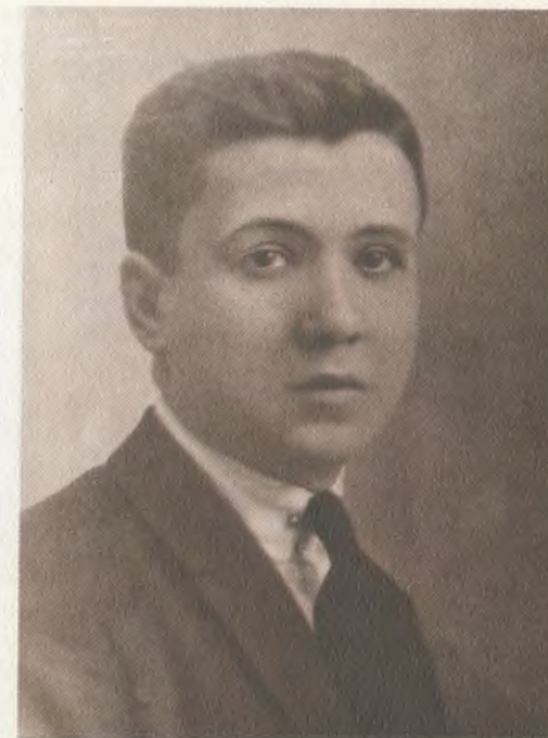
O Servo de Deus, aos quinze anos.