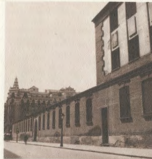
Asilo de Porta Coeli. Aqui, nos começos dos anos trinta, o Servo de Deus desenvolveu parte do seu imenso trabalho de Catequese.

Uma moça — hoje religiosa Serva de Maria — que trabalhava em casa de uma dessas famílias, assistiu às aulas que o Servo de Deus deu a oito crianças naquela