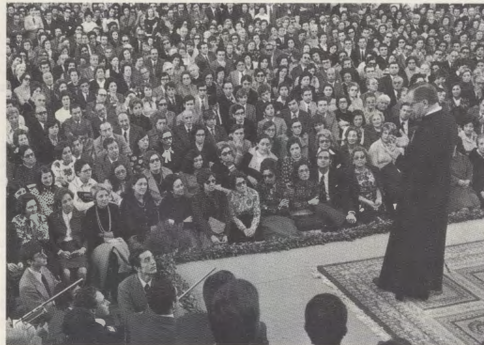
Durante uma tertúlia no Brafa, Barcelona (Espanha), a 22 de Novembro de 1972.