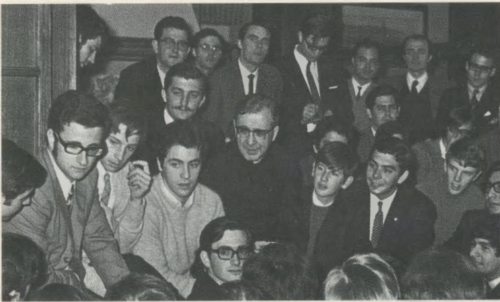
Roma, 26 de Março de 1970.

radiológico que fiz à Irmã Conceição foi a exploração do estômago, no dia 22 de Outubro de 1977. Não havia vestígios de úlcera gástrica.