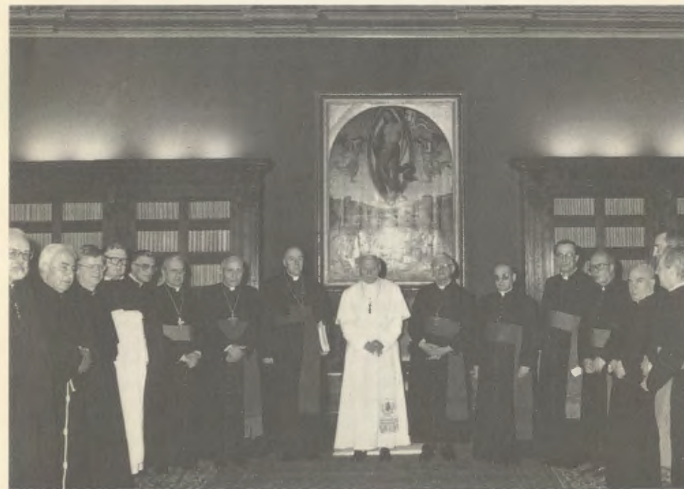
9 de abril de 1990. Após a leitura do Decreto de virtudes heróicas do Venerável Josemaría Escrivá.

Regnare Christum volumus! Esta foi a grande aspiração do Servo de Deus, que também se pode descrever assim: colocar Cristo no cume de todas as atividades humanas. O serviço eclesial de Josemaría Escrivá suscitou um impulso ascensional para Deus em homens imersos nas realidades temporais, de todos os ambientes e profissões, de acordo com aquelas palavras do Senhor — Et ego, si exaltatus fuero a terra, omnia traham ad meipsum (Jo 12, 32 Vg) —, nas quais o Servo