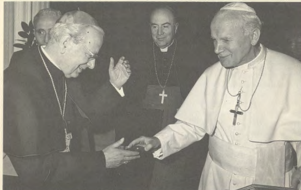
O Santo Padre, o Prefeito da Congregação dos Santos, Cardeal Felici, e o Prelado do Opus Dei, Mons. del Portillo, no dia 9 de abril de 1990, depois da declaração das virtudes heróicas do Venerável Josemaría Escrivá.

Em 1946, Josemaría Escrivá fixou o seu domicílio em Roma; em 1947 e 1950, obteve a aprovação do Opus Dei como instituição de direito pontifício. Com uma caridade infatigável e uma esperança ativa, promoveu e guiou a expansão do Opus Dei por todo o mundo, contribuindo para uma vasta mobilização de leigos conscientes da sua responsabilidade de participarem na missão da Igreja. Deu impulso a iniciativas de vanguarda no âmbito da evangelização e da promoção humana; suscitou por toda a parte vocações para o sacerdócio e para o estado religioso; empreendeu viagens extenuantes pela Europa e América, para difundir a doutrina da Igreja. E, sobretudo, dedicou-se à formação dos membros do Opus Dei — sacerdotes e leigos, homens e mulheres —, para lhes infundir uma sólida vida interior, unida a uma exemplar adesão ao Magistério da Igreja e