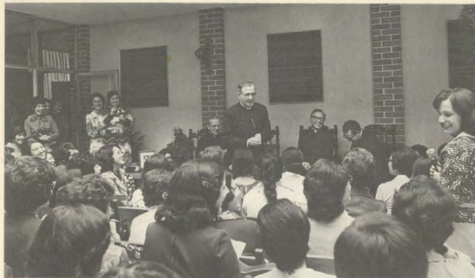
Guatemala, 1975, num Centro para a formação da mulher.

“O Dr. Escrivá é um sacerdote modelar, escolhido por Deus para a santificação de muitas almas, humilde, prudente, abnegado, extremamente dócil ao seu Prelado, de seleta inteligência, de muito sólida formação doutrinal e espiritual, ardentemente zeloso, apóstolo da formação cristã da juventude estudiosa” (AGP, RHF D 03545/2).