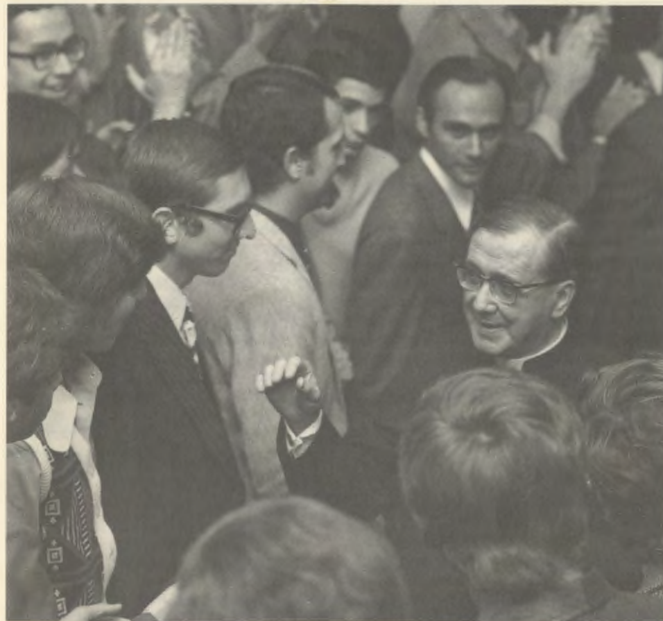
1974, São Paulo (Brasil).

Desde a fundação do Opus Dei, prestou à Igreja um serviço exímio, cheio de amor e de perseverança” (AGP, RHF P-00644, Carta ao Santo Padre, Osaka, 27-VII-1975).