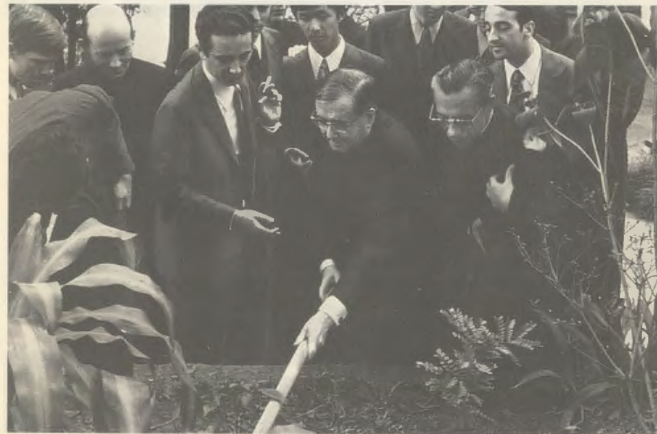
1974, Brasil, Sítio da Aroeira.

“Em diversas ocasiões tive oportunidade de encontrar-me pessoalmente com