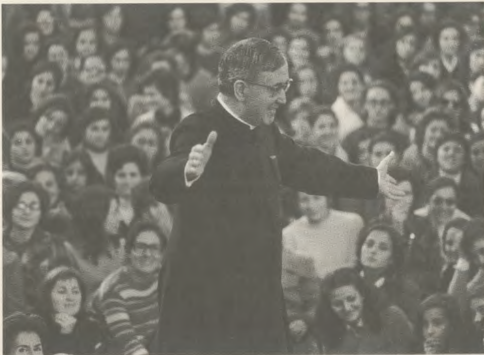
Durante uma tertúlia em Brafa, Barcelona (Espanha), no dia 25 de novembro de 1972.