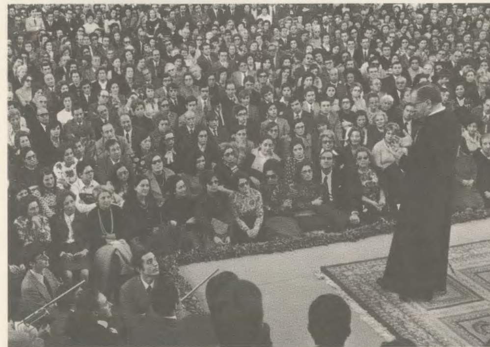
Durante uma tertúlia em Brafa, Barcelona (Espanha), no dia 22 de novembro de 1972.

Os Peritos Médicos que a visitaram em 1982, durante o Processo canônico, deixa-