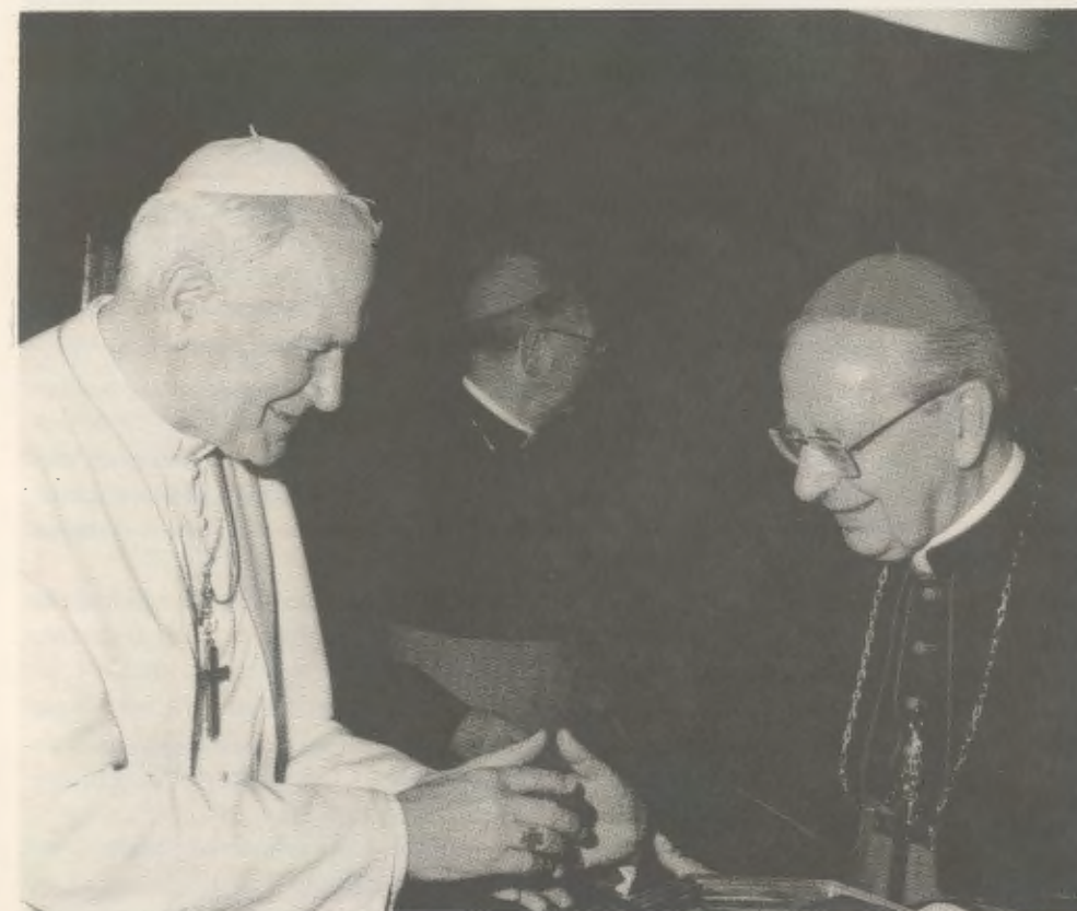
O Santo Padre, S.E. Revma. Card. Eduardo Martínez Somalo e o Prelado do Opus Dei, S.E. Revma. D. Álvaro del Portillo, em 6 de julho de 1991, após a leitura do Decreto.