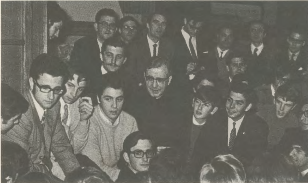
Roma, 26 de março de 1970.