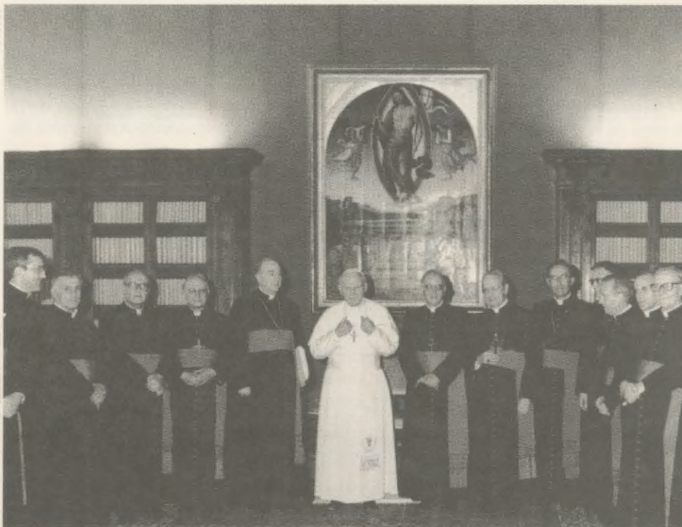
6 de julho de 1991. Após a leitura do Decreto do milagre atribuído à intercessão do Venerável Josemaría Escrivá.

ombro esquerdo. Acrescentava-se a esta doença uma patologia concomitante, diagnosticada pela Consultoria Médica nos seguintes termos: estado caquético em paciente com úlcera gástrica e hérnia de hiato complicada por uma grave anemia hipocrômica . No momento em que desapareceram as tumefações, esta segunda doença melhorou, também de modo repentino e inexplicável, até desaparecer definitivamente. A mesma Consultoria estabeleceu que o prognóstico era gravemente infausto quoad vitam e quoad valetudinem .