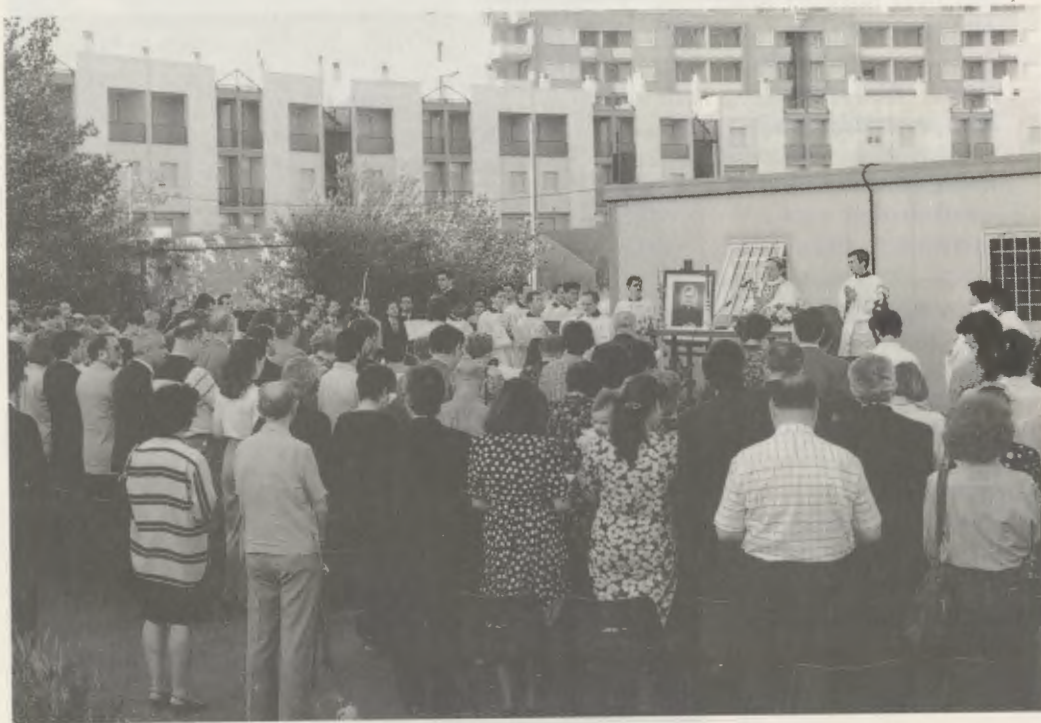
A primeira Missa em memória do Bem-aventurado Josemaría Escrivá celebrou-se no dia 26 de junho de 1993, no local onde será levantada a nova paróquia.

(*) As pessoas que estiverem interessadas em contribuir para essa construção podem enviar os seus donativos à Vice-Postulação do Opus Dei no Brasil, Rua João Cachoeira, 1496, CEP 04535-007, São Paulo, SP.