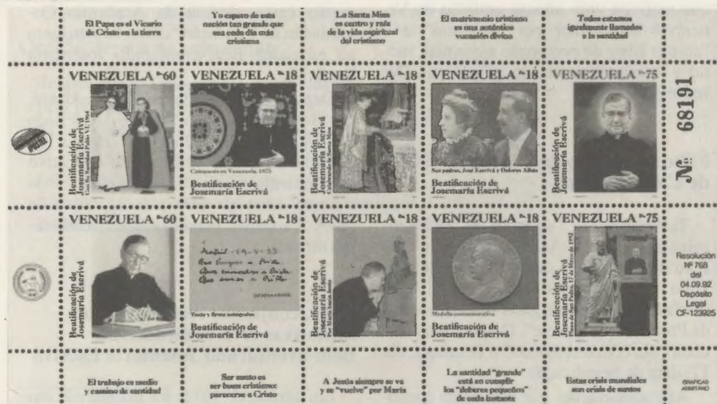
O Instituto Postal Telegráfico da Venezuela emitiu uma série de selos comemorativos da beatificação.