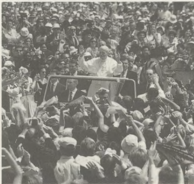
O Santo Padre entre os peregrinos, no dia 18 de maio de 1992.

tes da sociedade manifesta que a sua vida e a sua doutrina oferecem um ponto de referência eficaz para a nova evangelização à qual o Santo Padre vem convocando todos os cristãos. De fato, essa atualidade do espírito do Fundador do Opus Dei foi sublinhada com unânime insistência por muitos representantes da hierarquia eclesial, ao mesmo tempo que os documentos pontifícios da Causa do Bem-aventurado Josemaría Escrivá ressaltavam a fecundidade dos seus ensinamentos para toda a Igreja. No Breve da beatificação, lê-se: “Ao proclamar a radicalidade da vocação batismal, (Josemaría Escrivá) abriu novos horizontes para uma cristianização mais profunda da sociedade (...) e evidenciou toda a potência redentora da Fé, a sua energia transformadora, tanto para as pessoas como para as estruturas em que se plasmam os ideais e as aspirações dos homens”.