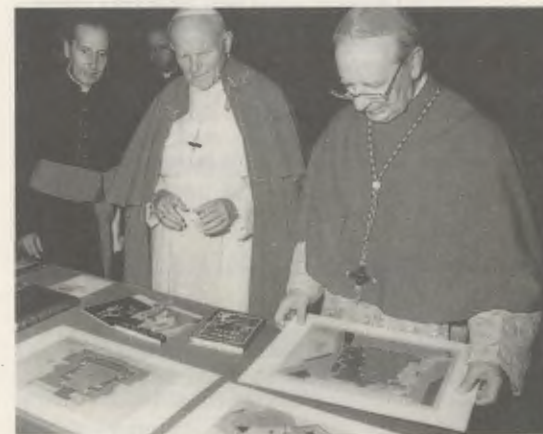
17 de maio de 1992. Depois da cerimônia da beatificação, Sua Excia. Revma. D. Álvaro del Portillo e Mons. Javier Echevarría mostram ao Santo Padre o projeto da paróquia dedicada ao Bem-aventurado Josemaría Escrivá, que se construirá em Roma.

Ao ensejo da beatificação, o Bispo D. Álvaro del Portillo, Prelado do Opus Dei, ofereceu ao Papa, em nome da Prelazia, a doação de uma igreja em Roma. O Card. Ruini decretou que a paróquia tivesse o título do novo Bem-aventurado e confiou-a à Prelazia do Opus Dei.