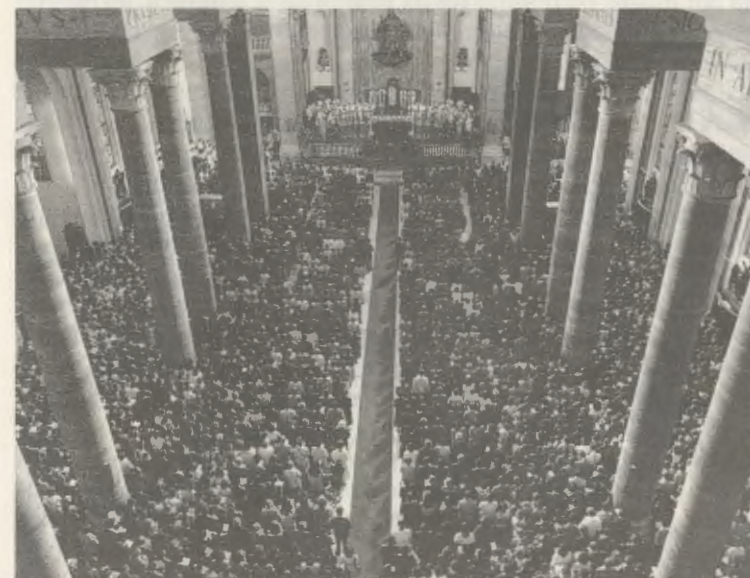
Missa em ação de graças pela beatificação do Fundador do Opus Dei, celebrada por Sua Excia. Revma. D. Álvaro del Portillo na Basílica de Santo Eugênio, a 21 de maio de 1992.

cartas de felicitação – de membros da hierarquia eclesial, de sacerdotes, de comunidades religiosas, de fiéis comuns –, reveladoras da convicção de que a elevação aos altares do Fundador do Opus Dei foi um dom providencial para toda a Igreja. Durante os dois anos decorridos desde então, multiplicou-se a difusão da mensagem de santidade do Bem-aventurado Josemaría Escrivá e a atenção despertada pe-