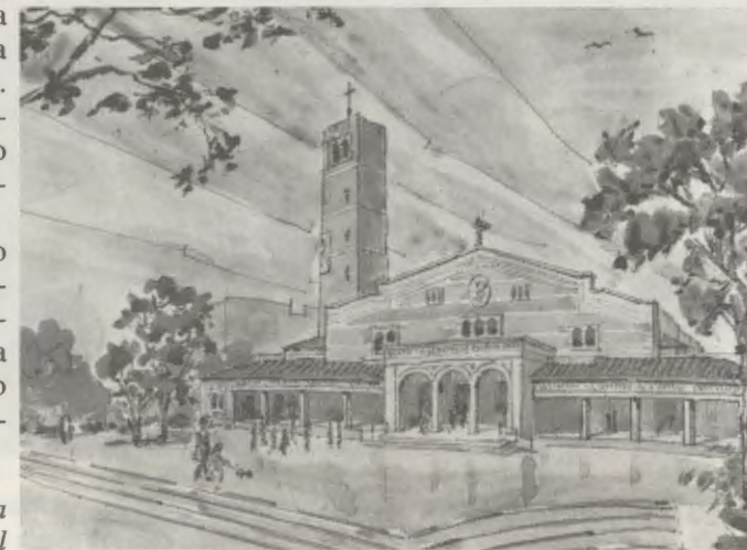
Perspectiva da nova igreja paroquial

O templo será construído num terreno cedido à diocese, num dos novos bairros que estão surgindo na periferia da cidade, muito próximo do lugar onde, se-