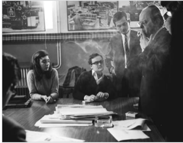
Imagen 4: Dando una clase práctica. Años 70.