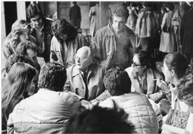
Imagen 5: Con sus alumnos en el bar de la Universidad de Navarra. Años 80.