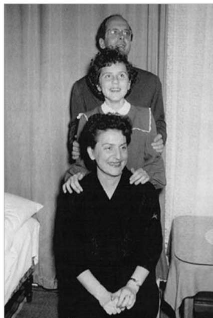
Imagen 3: El reencuentro de la familia en Múnich tras doce años de separación por la Guerra Fría. 1956.