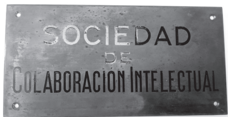
Placa de So-Co-In que se puso, en agosto de 1940, en la puerta del piso de la calle Martínez Campos.