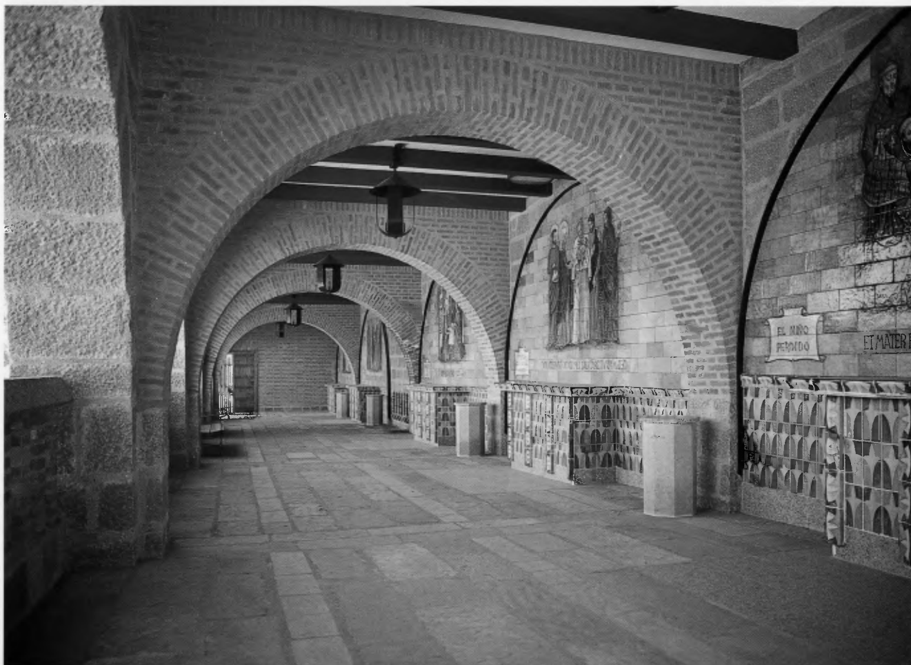
Galería de los Misterios Gozosos.

El aire tan sencillo de los Misterios Gozosos