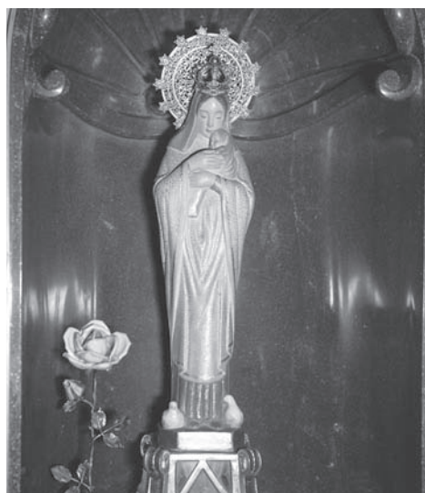
Imagen de la Virgen que san Josemaría pidió al escultor Jenaro Lázaro, en 1934, para las mujeres del Opus Dei. La fotografía es de 1975.