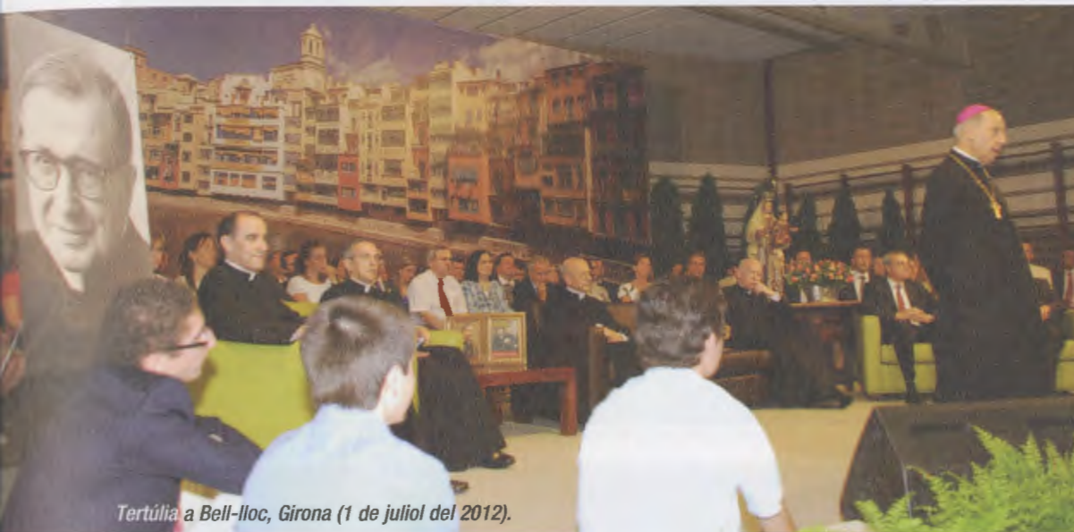
Tertúlia a Bell-lloc, Girona (1 de juliol del 2012).

Mons. Javier Echevarría, que va ser durant vint-i-quatre anys prelat de l'Opus Dei i estret col·laborador del Fundador i del beat Àlvar del Portillo, va tenir una gran vinculació amb Catalunya.