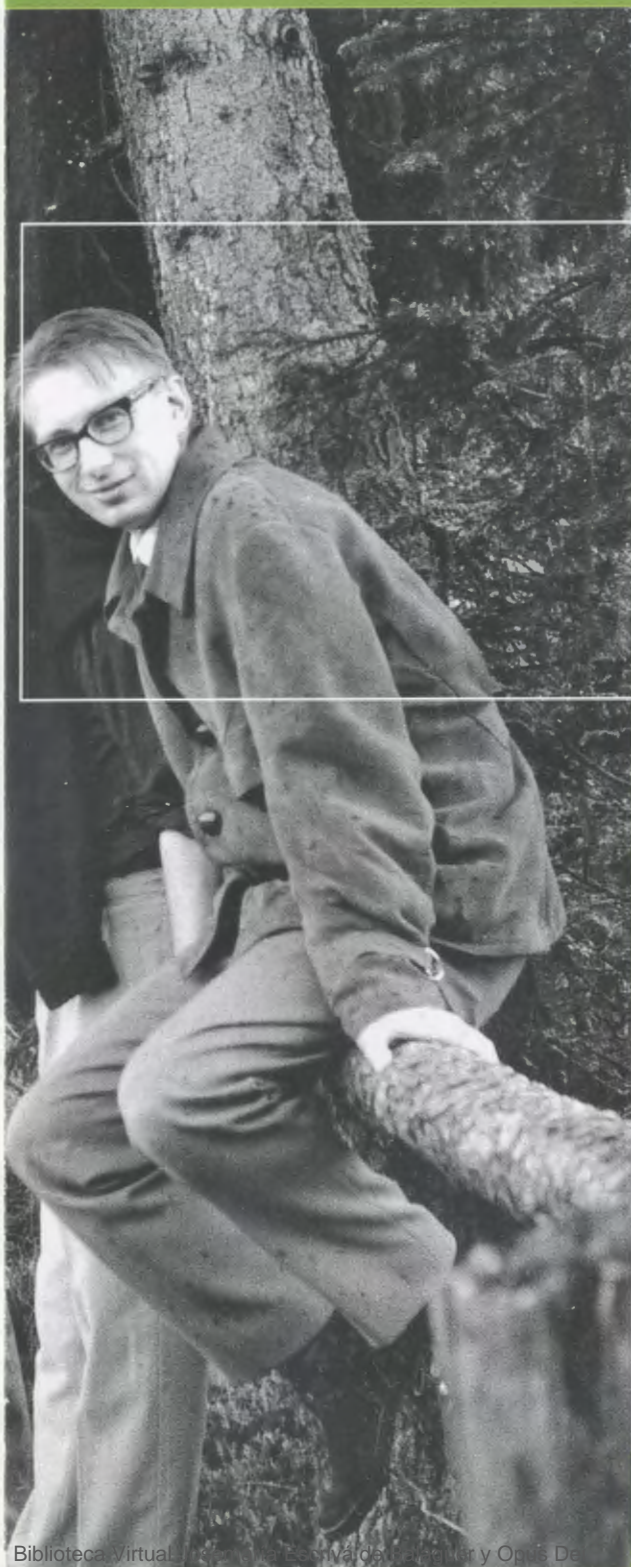
En 1962, lors d'une excursion en montagne.