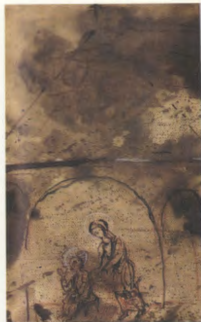
Para los misterios de Dolor: