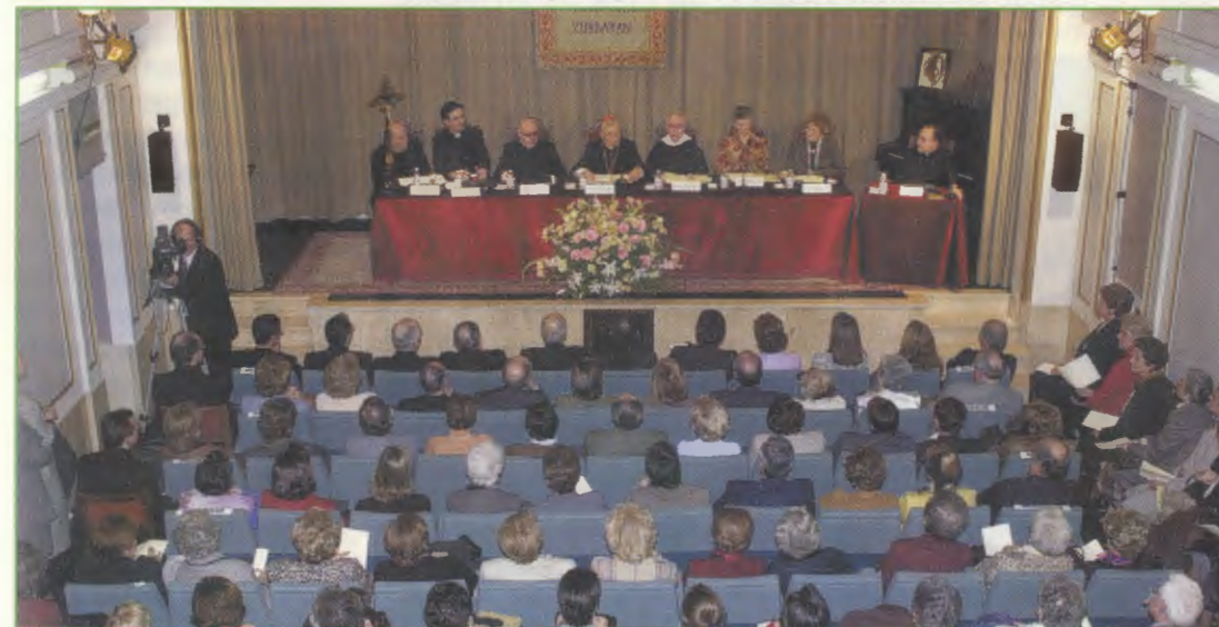
La apertura del Proceso Diocesano reunió a numerosos amigos y familiares de Guadalupe.

La Causa de Canonización que acaba de empezar seguirá su tramitación, según las normas canónicas que garantizan la objetividad y la autenticidad del juicio.