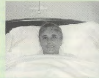
Una de sus últimas fotos, en la Clínica Universitaria de Navarra.

la oportunidad de afrontar una arriesgada operación, el 26 de junio fallece en Roma el beato Josemaría. El 1 de julio es operada finalmente y se recupera, e incluso sale de la Clínica dando un paseo que le lleva a visitar la ermita de la Virgen del campus universitario. Sin embargo, dos semanas después entra en una profunda crisis que obliga a internarla en la UVI donde recibe la Unción de los Enfermos.