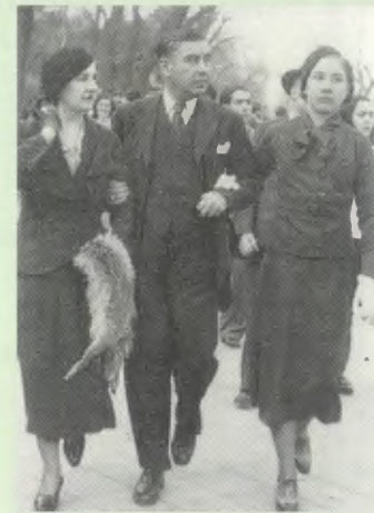
Paseando con su hermano.

Pasa la guerra con su madre en Valladolid.