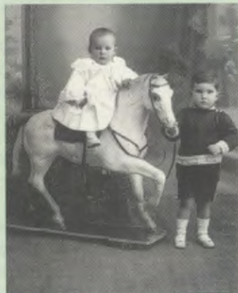
Con su hermano.

31 de agosto. Empieza los estudios primarios en el Colegio La Emulación de Segovia, ciudad a la que se traslada por el destino de su padre a la Academia de Artillería.