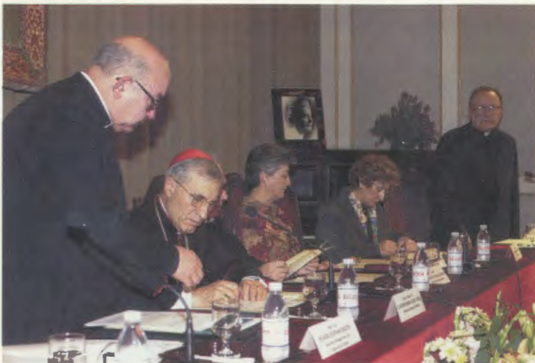
El Tribunal juró sus cargos en el Colegio Mayor Zurbarán.

Iglesia archidiocesana de Madrid que tome la vida de Guadalupe en consideración y reúna todas las pruebas necesarias para que pueda ser examinada con profundidad y determinar si puede ser considerada como ejemplo y como intercesora para todos los cristianos de nuestro mundo”.