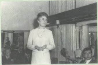
Durante una conferencia.