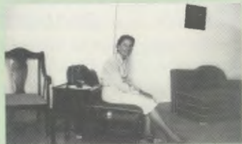
Primeros días en México.

15 de septiembre. Se incorpora como primera directora de la Residencia Universitaria Zurbarán de Madrid. Se matricula en cinco asignaturas para el doctorado en Ciencias Químicas.