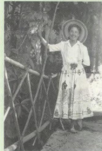
Durante una excursión al campo.

Viaja a Madrid y Roma para participar en el Congreso General de las mujeres del Opus Dei y estudiar, con la experiencia adquirida, el desarrollo de la labor apostólica en México en los años siguientes.