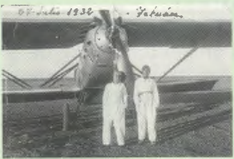
Un viaje en avioneta antes de regresar a Madrid.