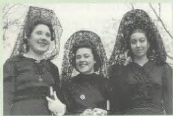
Con la tradicional mantilla española un día de fiesta.

La familia regresa a Madrid y Guadalupe termina el bachillerato en el Instituto Miguel de Cervantes.