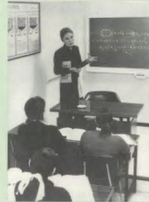
Durante diez años dio clases en la Escuela de Maestría Industrial.

Congreso General. A su vuelta, comienza a dar clases de Química en el Instituto Ramiro de Maeztu y, posteriormente, como profesora interina de Física y Química, y Matemáticas, en la Escuela de Maestría Industrial.