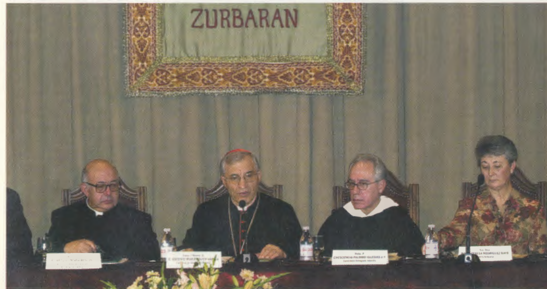
El Cardenal de Madrid, Antonio María Rouco, publicó el Decreto de Introducción de la Causa el 18 de noviembre de 2001.