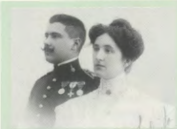
Los padres de Guadalupe.