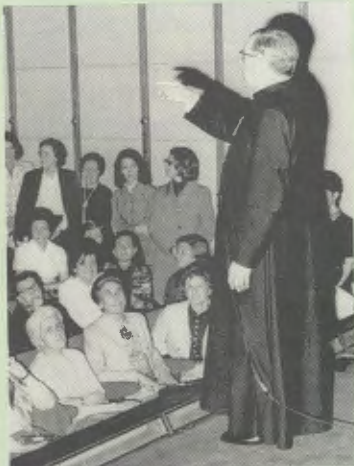
En un encuentro con el beato Josemaría.

15 de mayo. Puede ver al Fundador del Opus Dei por última vez.