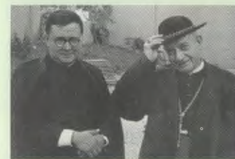
El beato Josemaría, junto al entonces obispo de Madrid-Alcalá, Don Leopoldo Eijo y Garay.

Junio. Finaliza la licenciatura en Ciencias Químicas y comienza a dar clases en dos colegios: Liceo Francés y Colegio de las Irlandesas.