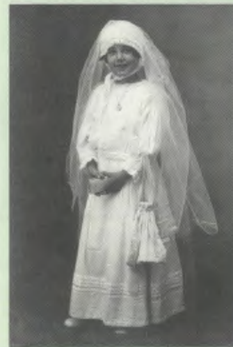
El día de su Primera Comuni3n.