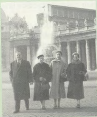
Junto a su madre, su hermano y su cuñada, en la Plaza de San Pedro.