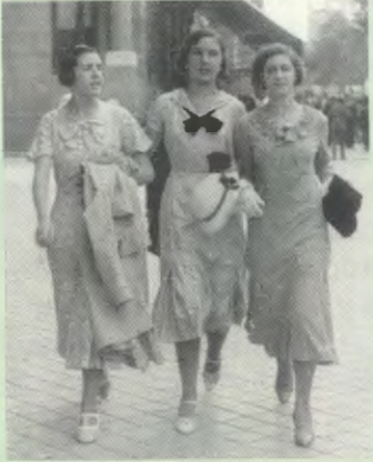
Un paseo por Madrid.