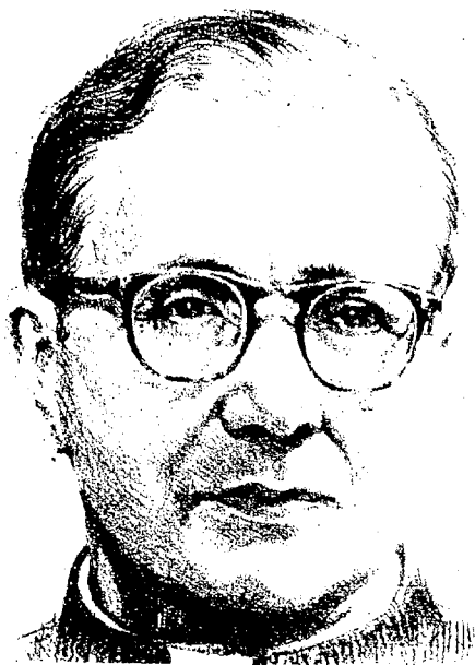
josémaría escrivá de balaguer