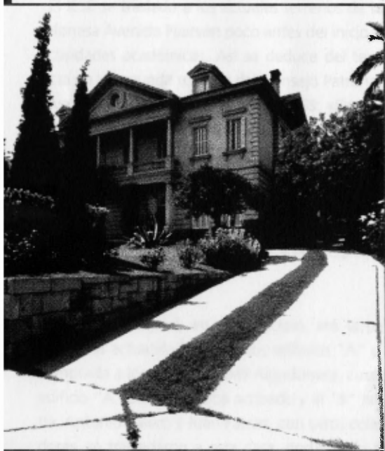
Edificio A en noviembre de 1958