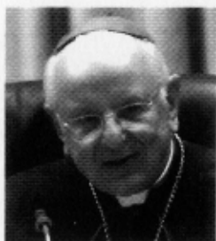
Mons. Francesco Monterisi Secretari de la Congregació per als Bisbes

Intervenció de Mons. Francesco Monterisi, secretari de la Congregació per als Bisbes en la commemoració del 25è aniversari de l'Opus Dei com a Prelatura Personal a Madrid, el 2 de maig de 2008. Aquesta intervenció adquireix una especial rellevància en coincidir l'esmentat aniversari amb els 80 anys de la fundació de l'Obra, el 2 d'octubre d'aquest any 2008.