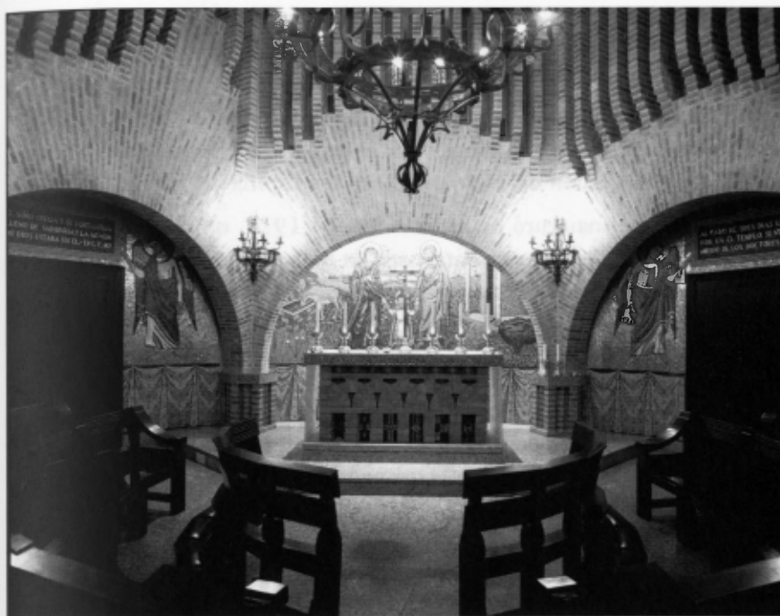
Capilla de la Sagrada Familia.