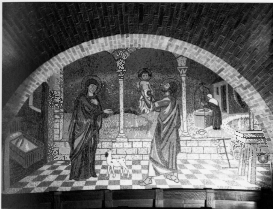
La Sagrada Familia en Egipto.