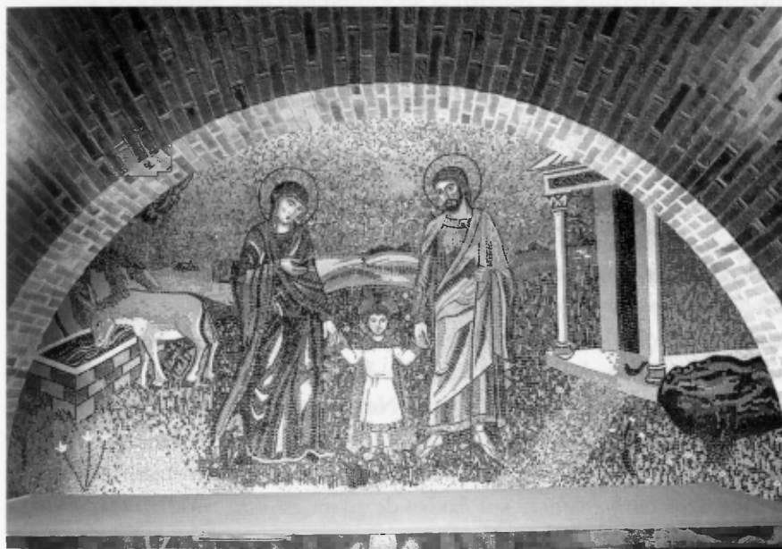
La Sagrada Familia y “borrico”.

En la literatura española ha existido una tradición de la laus asini , de carácter alegórico, en la que participó también san Josemaría 16 . Desde su época madrileña, que sepamos, san Josemaría comenzó a identificarse con un borrico, un borrico de Dios 17 . Conservamos un escrito suyo del año 1932 que resulta muy gráfico: “Esta mañana, como de costumbre, al marcharme del