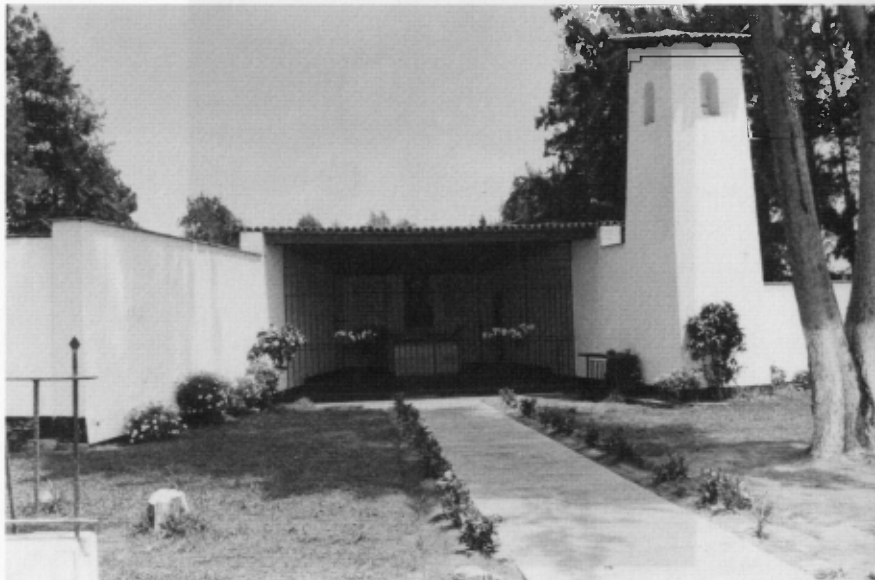
Ermita de Nuestra Señora del Amor Hermoso.