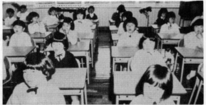
L'école Seido Shogakko, à Nagasaki (Japon), créée à l'initiative des membres de l'Opus Dei

s'agit d'une vocation proprement dite — poussés par le désir de recevoir une formation spirituelle et de mettre en œuvre les moyens ascétiques nécessaires pour que leur travail, intellectuel ou manuel — à l'université, au bureau, à l'usine, dans les tâches du foyer, etc. — soit une occasion et un instrument de sainteté et d'apostolat.