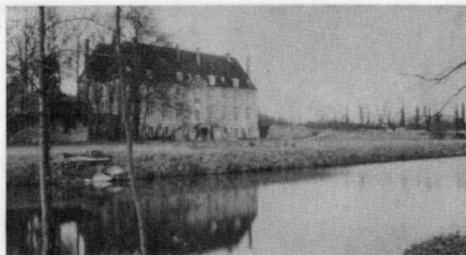
Le Centre de Rencontres de Couvrelles, dans l'Aisne (France)

Il s'agit du travail professionnel de citoyens laïcs, égaux à leurs compagnons qui exercent la même tâche ou le même métier. En aucun cas, ces œuvres ne sont officiellement ni même officieusement catholiques : ce sont des initiatives privées qui naissent et se développent en conformité avec les lois civiles de chaque pays, sans privilèges d'aucune sorte, et sont soumises aux mêmes conditions que les activités promues par n'importe quel autre citoyen, fondation ou association. Leurs dirigeants en répondent directement devant les autorités civiles compétentes.