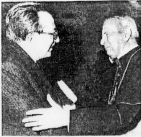
Monsignor del Portillo con Andreotti. «Il nostro fondatore Escrivá era persuaso che i preti che non parlano di Dio, ma d'altro, sono dei clericali»

Direi piuttosto che monsignor Escrivá è l'apostolo della «santificazione del lavoro». E ci ha insegnato a scoprire che Cristo ci aspetta proprio qui, nel lavoro quotidiano, perché attraverso il lavoro l'uomo conferma di essere fatto «a immagine e somiglianza» del Creatore.