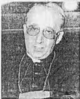
Il cardinale Camillo Ruini, presidente della Conferenza episcopale. Sotto, Giovanni Paolo II