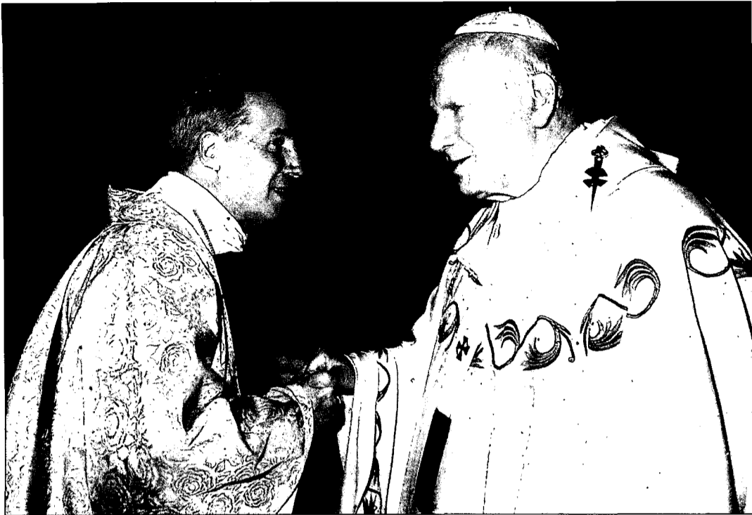
Javier Echevarría amb el papa Joan Pau II.

en sentit estricte. La família, cèlula fonamental de la societat, constitueix un projecte comú que depèn de l'aportació de tots: del marit, la dona, els fills... Penso, concretament, que en els nostres dies és molt necessari recordar la grandesa de la paternitat i la responsabilitat del pare en la família. Però sense plantejaments excloents, perquè si el pare és fonamental, ho és igualment la mare. Negar el valor immens i insubstituïble de l'aportació de la dona a la família equival a tancar els ulls a la realitat. No em refereixo a l'habilitat per a les tasques de la llar, sinó més aviat a una sèrie de qualitats morals, que no es poden resu-