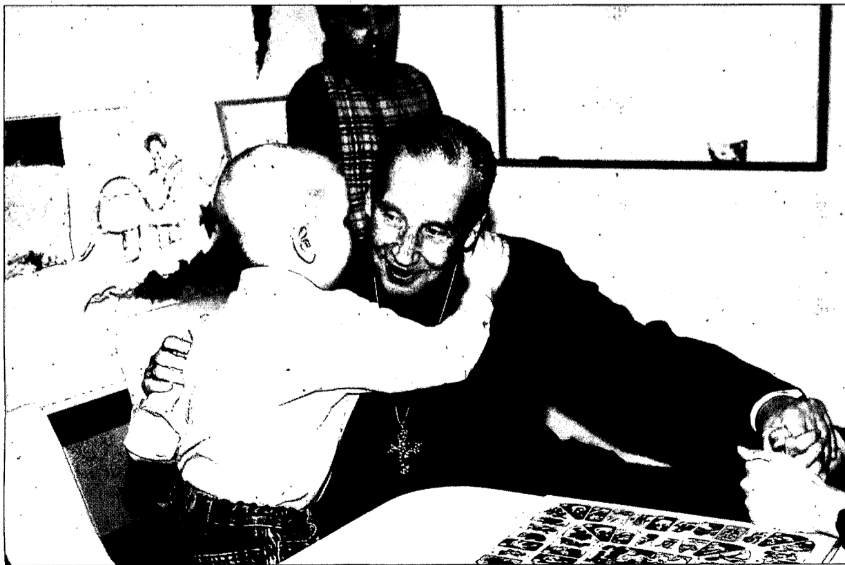
Mons. Echevarría defensa una assistència que sigui evangelitzadora.

—Se sent orgullós de pertànyer a l'única prelatura personal del món?