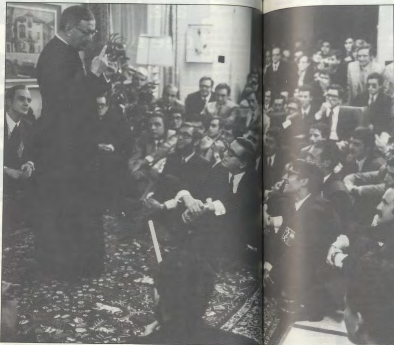
El fundador del Opus Dei dirigiéndose a un grupo de estudiantes.

Aquel octubre fue soleado. El verano quiso prolongar su presencia hasta bien entrado el curso académico. No conocía la Universidad de Navarra. Mi llegada a Pamplona coincidió con una reunión multitudinaria. Se celebraba la VII Asamblea de la Asociación de Amigos de la Universidad de Navarra. Un sacerdote celebraba la Santa Misa en un altar improvisado en medio de la explanada del campus. Escuché con atención su homilía. Decía cosas con mucho sentido común, pero que, paradójicamente, hasta entonces no había escuchado: «Dios os llama a servirle y desde las tareas civiles, materiales, seculares de la vida ordinaria: en un laboratorio, en el quirófano de un hospital, en el cuartel, en la cátedra universitaria, en la fábrica, en el taller, en el campo, en el hogar de familia y en todo el