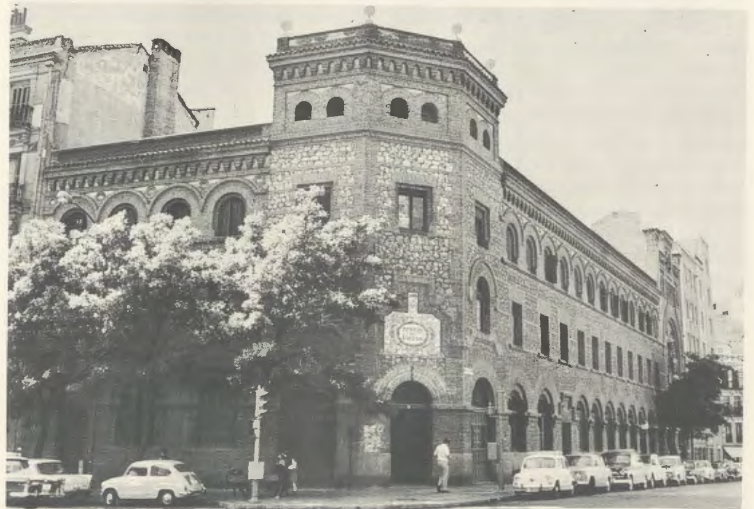
Madrid, Patronato dos Doentes.

«Para nós foi um grande benefício termos D. Josemaría como Capelão do Patronato. Recordo as nossas actividades apostólicas nos bairros periféricos de Madrid; os hospitais estavam a abarrotar