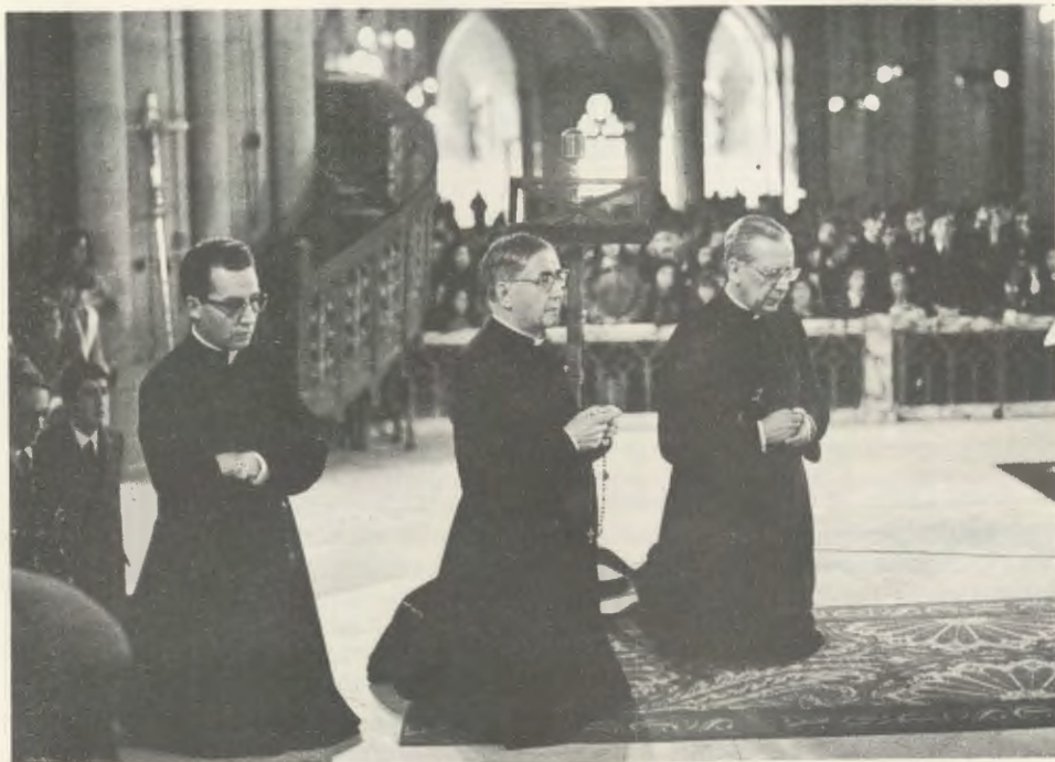
Mons. Escrivá de Balaguer reza no Santuário de Nossa Senhora de Luján (Argentina), a 12 de Junho de 1974. Ao seu lado, o actual Presidente Geral do Opus Dei, Rev. Doutor Álvaro del Portillo, e o Rev. Doutor Javier Echevarría, Secretário-Geral da Obra.

No entanto, é frequente ouvir-se perguntar: como fazer oração? Numa homilia pronunciada em 4 de Abril de 1955, temos a resposta do Fundador do Opus Dei: Como fazer oração? Atrevo-me a assegurar, sem receio de me enganar, que há muitas, infinitas maneiras de orar, poderia dizer. Mas eu preferia para todos nós a autêntica oração dos filhos de Deus, não o palavreado dos hipócritas que hão-de ouvir de Jesus: nem todo o que me diz: Senhor!, Senhor!, entrará no reino dos céus (Mt. VII, 21). Os que são movidos pela hipocrisia, podem talvez conseguir o ruído da oração – escrevia Santo Agostinho –, mas não a sua voz, porque aí falta vida (2) e há ausência de afã por cumprir a Vontade do Pai. Que o nosso clamor – Senhor! – vá unido ao desejo eficaz de converter em realidade essas moções interiores, que o Espírito Santo desperta na nossa alma.