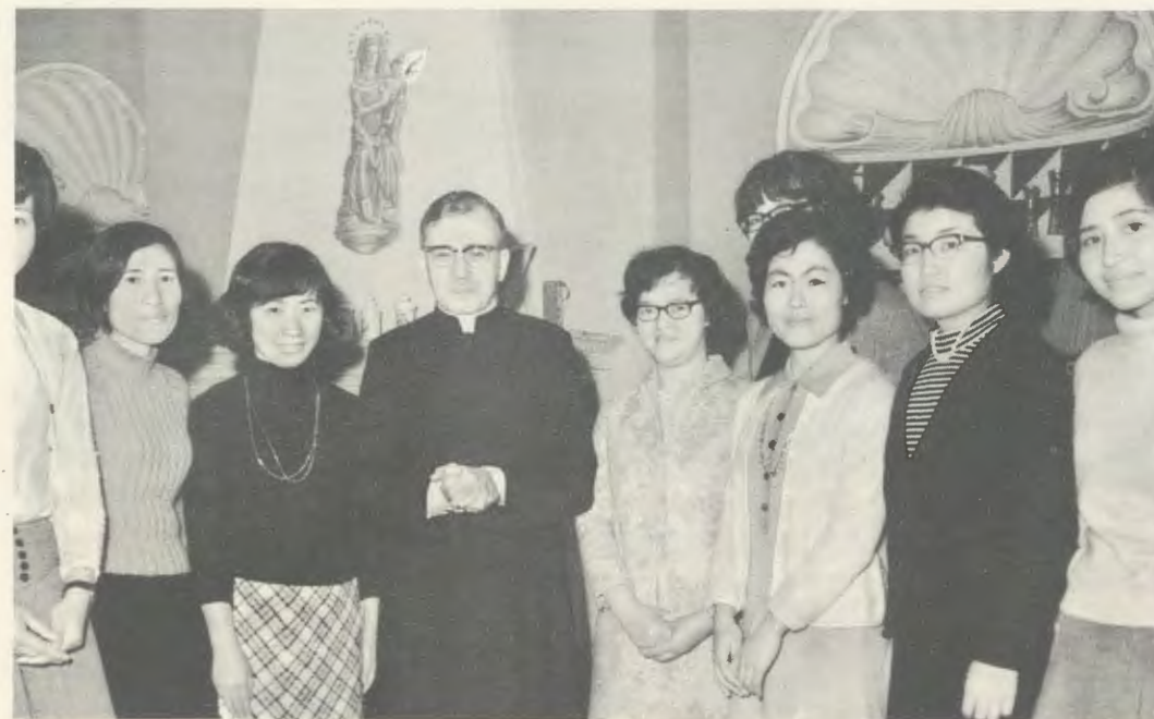
Roma, Março de 1970 – Mons. Escrivá de Balaguer com um grupo de japonesas do Opus Dei.

grande, para que conheçam Jesus Cristo e O amem e sirvam. Já sabes que agora as tuas irmãs do Japão estão a preparar-se para abrir um colégio em Nagasaki. Há que rezar para que as dificuldades desapareçam, para que possam começar quanto antes a trabalhar ali...».