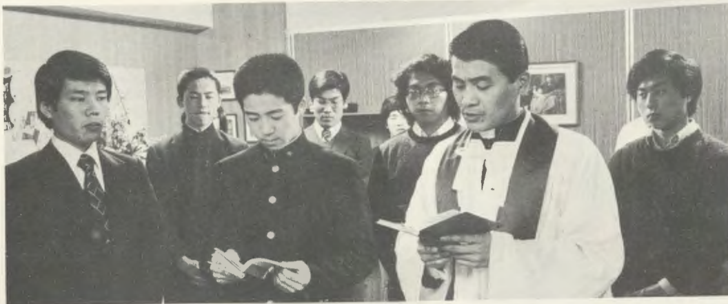
Cerimónia do Baptismo de um aluno. Administra o Sacramento o Pe. Soichiro Nitta, um dos primeiros sócios japoneses do Opus Dei que foram ordenados sacerdotes.

«Acompanho-vos com carinho – escrevia o Padre – e rezo sempre por vós! Que alegria ver essas conversões e as outras que se pressentem!».