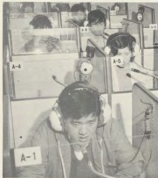
Trabalho no laboratório de línguas de SEIDO.

«Pelo Baptismo, Deus Nosso Senhor deu-te o sentido da Igreja. Reza pelos da tua terra, porque é um povo muito