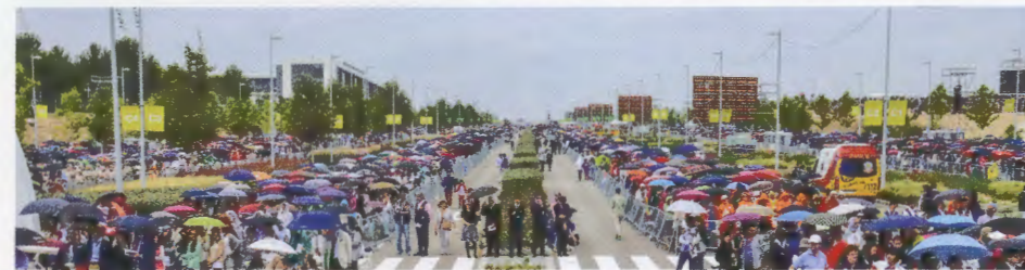
28 september: zonder bang te zijn voor de regen.

Om te beginnen: dank U. Het is de directe en spontane reactie die in een ziel opkomt tegenover de goedheid van God. Het kan niet anders. Hij gaat ons altijd voor. Hoe we ons ook inspannen, Zijn liefde komt altijd eerder; Hij is de eerste die ons aanraakt en ons liefkoost. Hij neemt het initiatief. Álvaro del Portillo was zich bewust van de vele gaven die God hem geschonken had en hij dankte God voor deze blijken van vaderlijke liefde. Maar hij liet het niet daarbij; de erkenning van de liefde van de Heer voor hem, wekte in zijn hart verlangens om Hem met grotere overgave en edelmoedigheid te volgen en om een leven te leiden van nederige dienstbaarheid aan de anderen. Bijzonder opvallend was zijn liefde voor de Kerk, bruid van Christus. Hij diende haar met een hart vrij van aardse interesses, ver van tweedracht, hartelijk voor iedereen en altijd op zoek