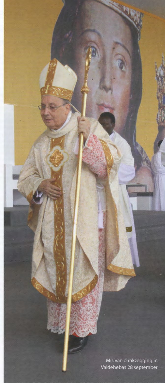
Mis van dankzegging in Valdebebas 28 september