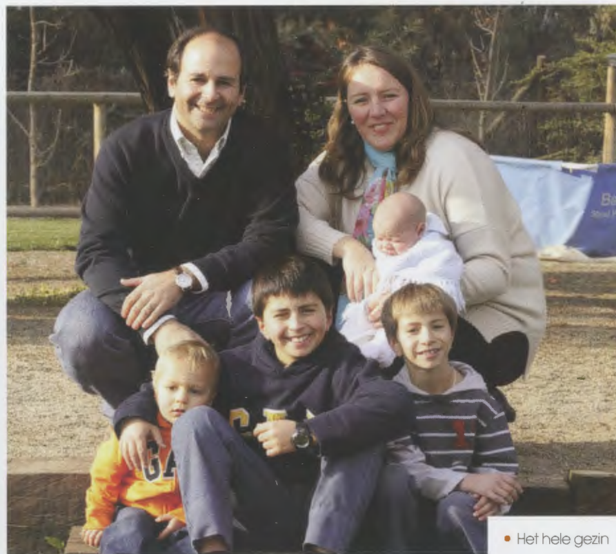
• Het hele gezin