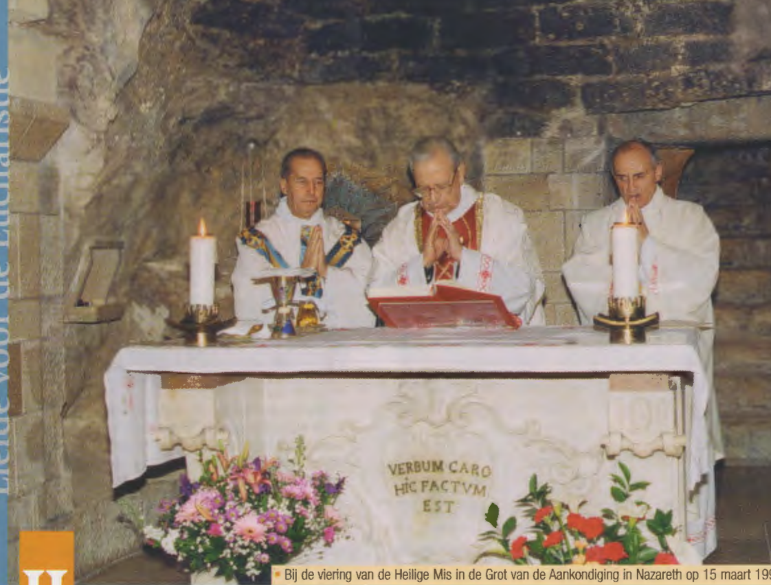
• Bij de viering van de Heilige Mis in de Grot van de Aankondiging in Nazareth op 15 maart 1995