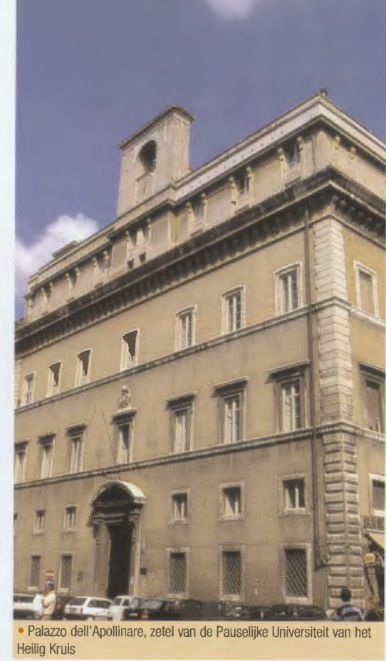
• Palazzo dell'Apollinare, zetel van de Pauselijke Universiteit van het Heilig Kruis

« Zonder deze hulp, groot of klein, maar altijd een vrucht van de liefde tot God en eerbied voor het priesterschap, zou al het goede dat verricht wordt ten dienste van de Kerk, nooit tot stand kunnen komen », zei kort geleden Mgr. Javier Echevarría, prelaat van het Opus Dei, over de mensen die economisch bijdragen aan de universiteit.