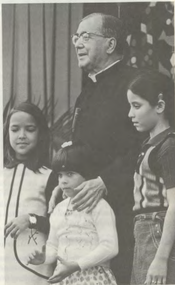
Ad Altoclaro (Venezuela), l'8 febbraio 1975.

Quegli uomini di Dio che possiamo aver conosciuto lungo la nostra vita o tramite l'agiografia ci appaiono tanto compresi nella loro missione, uniti a Dio e dotati di un gran cumulo di virtù, che già la loro presenza o il ricordo di loro ci obbligano a entrare in un ambito trascendente. Sono persone che creano intorno a sé una speciale tensione spirituale, dove appare normale il fatto più inatteso o peculiare. Il Padre nascondeva, in qualche modo, la grande distanza reale a cui veramente si trovava rispetto ai suoi interlocutori, grazie alla sua grande umanità, alla simpatia travolgente e al buonumore, alla comprensione e all'affetto manifestati verso tutti» (AGP, RHF T-06181, Siviglia, 21 novembre 1977).