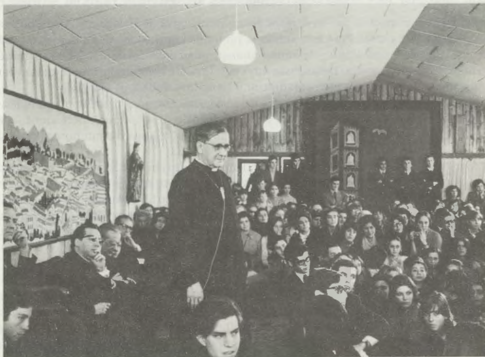
Durante un incontro familiare a Tabancura (Cile), il 7 luglio 1974.

Egli visse in grado eroico le virtù cristiane e umane [...]. Non c'era in lui nessuna conversazione, nessun gesto, nessuna iniziativa, nulla, che non fosse eo ipso catechesi e apostolato