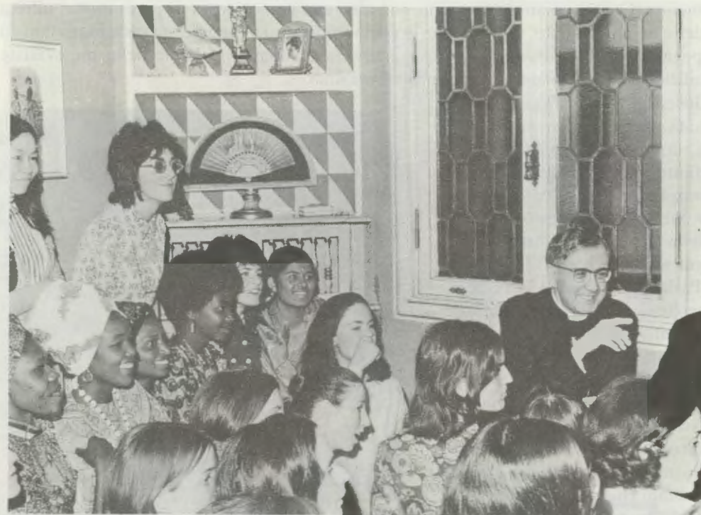
Il 31 marzo 1972, a Roma.

Commovente era la sua devozione alla Madonna e all'Eucarestia.