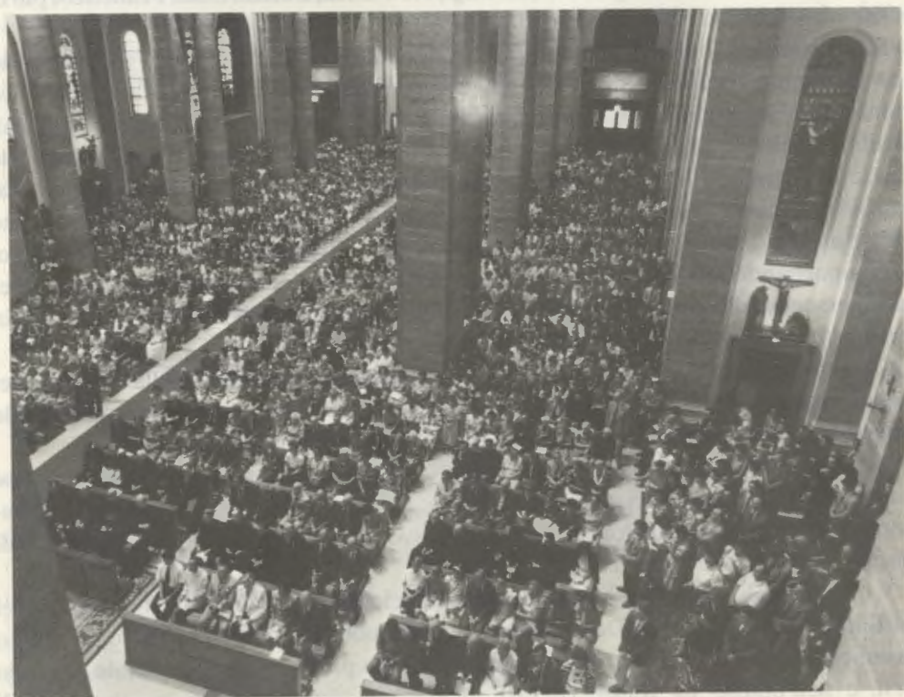
Roma, 26 giugno 1990: Messa di ringraziamento nella basilica di Sant'Eugenio.

Tra le cento Messe celebrate in Spagna hanno destato particolare commozione quelle tenutesi in luoghi strettamente legati alla persona e all'apostolato di monsignor Escrivá: a Barbastro, dove la funzione è stata celebrata dal vescovo, monsignor Ambrosio Echebarría Arroita; a Logroño, dove il vescovo, monsignor Ramón Búa, ha commentato alcuni avvenimenti degli anni trascorsi dal Servo di Dio in quella città; a Madrid e in altre città. A Valencia l'arcivescovo, monsignor Miguel Roca Cabanellas, ha invitato i presenti a imitare l'amore del fondatore dell'Opus Dei verso il sacramento della Penitenza e la sua fiducia nella Madonna.