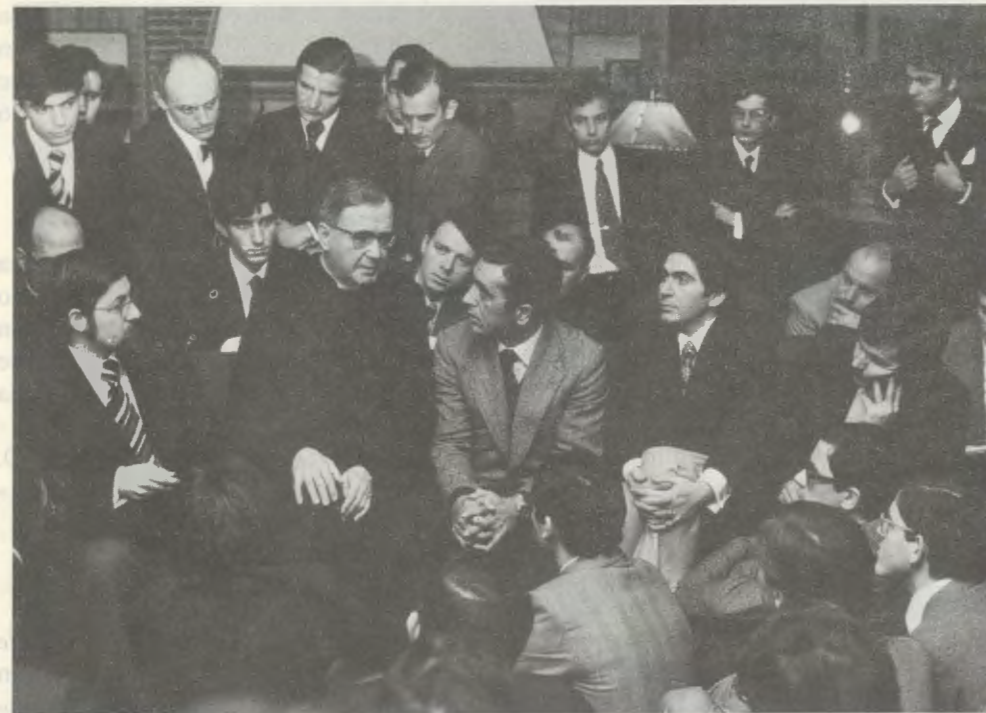
Natale del 1974, nella Sede centrale dell'Opus Dei, a Roma.

[...]. E non ci fu nessun incontro, nessun colloquio con lui che non mi abbia procurato nuovo slancio, maggior amore al Signore e alla Chiesa, maggior forza nella fede [...].