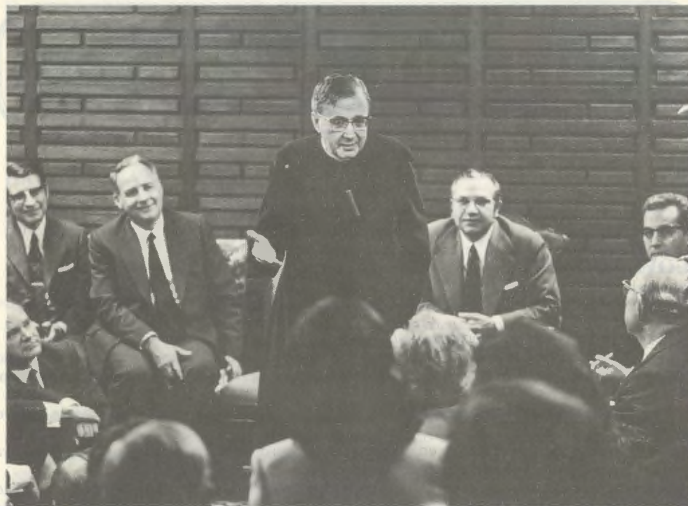
Il 19 novembre 1972, a Valencia (Spagna).

Tale latitudo cordis era la caratteristica essenziale di questo sacerdote. Amava gli uomini nel senso più vero della parola, si preoccupava di loro, se ne prendeva cura. Quando