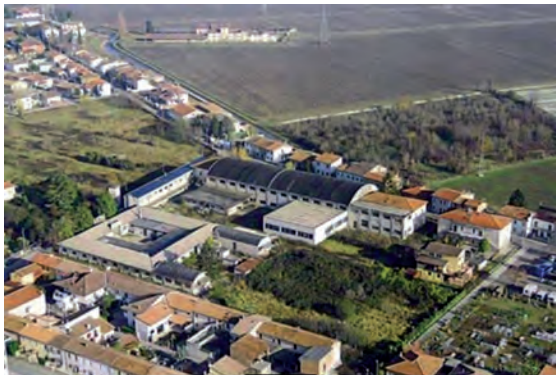
Il Ricamificio Automático negli anni '80.